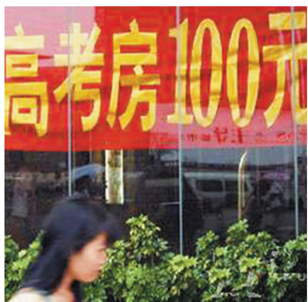
內地商家推出天價高考房。

深圳共有33,166名考生走進高考考場，較去年增加16%，再創歷史新高。為此，深圳不少的士公司也向學生提供便利，多家出租車公司專門為考生提供免費接送服務，預計有超過一千輛的士參與。