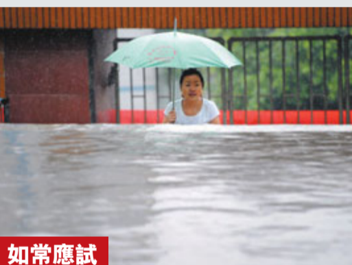
如常應試 貴州災區考生如常參加考試。 新華社

中央氣象局昨日發布高溫藍色預警，預計未來3天，華北、黃淮、江漢等地將出現35度以上高溫。