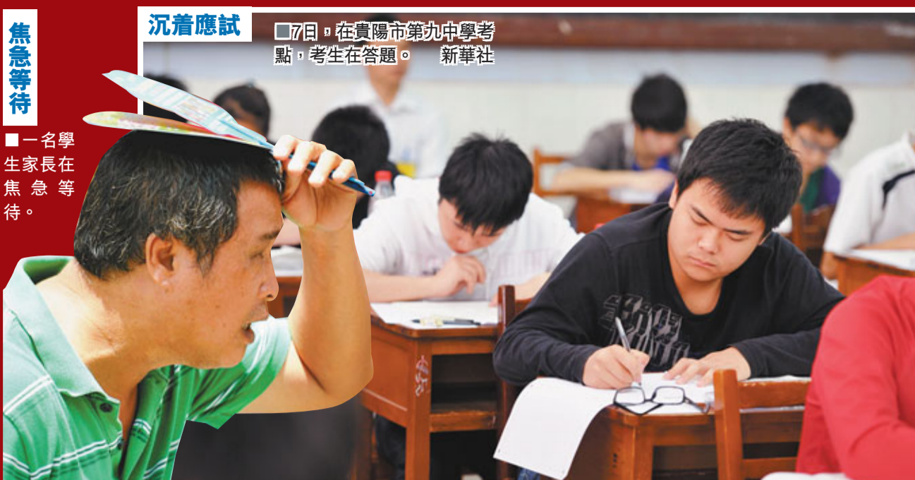
沉着應試 7日，在貴陽市第九中學考點，考生在答題。