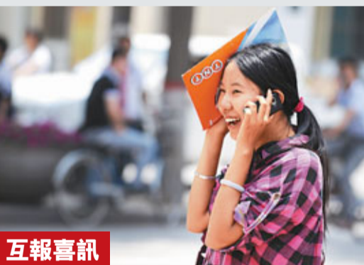
互報喜訊 在山西省太原五中考點外，一名考生在參加完語文科目考試後與同學通電話。

香港文匯報訊 (記者 熊君慧 深圳報道) 中華英才網昨日發佈調查報告稱，區域薪酬差距影響高考志願填報。區域經濟活躍程度與區域薪酬水平呈正比，經濟越活躍的區域，人才的就業選擇越多樣化，公司對人才的競爭也越激烈，區域的綜合薪酬水平也越高。同時，專家也建議，區域差距正在減小，填報志願宜長遠眼光，理性選擇高校所在地區。選擇就讀薪酬水平較高的地區不僅需要考量成績是否達標，還要考慮個人適應能力、家庭經濟能力等。