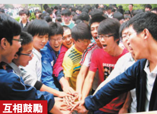
互相鼓勵 7日，在江蘇揚州市邗江中學考點，幾位考生在進入考場前相互鼓勵加油。 新華社

香港文匯報訊 (記者 李望賢 深圳報道) 3月份開辦的南方科技大學教改實驗班45名學生，此前集體發出公開信表示拒絕參加高考。昨日(7日)，有媒體記者在微博上指已經證實南科大學生確實未參加高考，學校提前預備的兩個考場因無學生參考在開考15分鐘後取消。記者致電南科大校長朱清時，但無人接聽。朱清時此前表示，學生若參加高考，便失去改革的意義，但學校會尊重學生們的意願，畢竟高考對每一個學生來講關係到他們的命運。