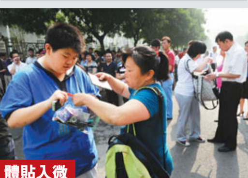
體貼入微 7日，在北京的東直門中學考點，考生進入考場前，家長給孩子們檢查考試用具。

香港文匯報訊 (記者 沙飛 廣州報道) 恰逢內地高考，記者從廣東省氣象部門獲悉，目前廣東處於龍舟雨時期，預計未來3日有較大範圍雷雨天氣。為此，有考生家長擔心天氣惡劣影響出行，更怕雷聲太大影響英語考試聽力環節。