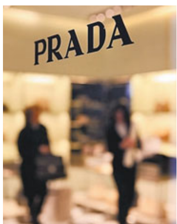
■Prada近年在內地急速擴張。