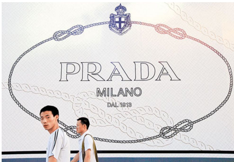
意大利品牌Prada計劃本月13日起開始招股，24日掛牌。

對於Prada來說，「上市」並不陌生，因為這已經第五次試圖上市。Prada前四次上市計劃分別碰上01年美國「911事件」、02年世通公司(WorldCom)會計醜聞以及08年金融海嘯等，其上市之路可謂是一波四折。