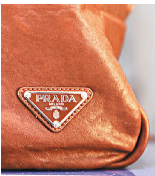
Prada旗下自產產品大部分屬於樣板。

香港文匯報訊(記者 蔡競文)名牌之所以受人追捧及昂貴，除多年建立的名氣、款式領導潮流之外，做工及質量也是重要因素，這亦難怪乎傳媒糾