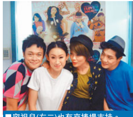
■容祖兒(右二)也有來捧場支持。

香港文匯報訊(記者 李思穎)王菀之與「風車草劇團」合作演出十四場的歌舞劇《I LOVE U BECAUSE》，於前晚順利完成，菀之最終變成「大喊包」流下不捨的眼淚，此劇令她最大收穫是學曉挺胸收腹，不再像男人行路。菀之表示原本不想太感觸，可是臨別依依，她唱到最後一首歌時已經忍不住喊，到謝幕更加無法忍住，今次面對的都是演戲高手，所以更加珍惜這次演出機會。菀之自言今次的角色挑戰很大，她笑說：「我平日行路十分Man，為了這個角色搵專人教導行路儀態，連聲線如何發音也要再學，連劇團的同事都笑我係王伯，因為行路太似男人，Sexy欠奉，所以而家我學到挺胸收腹，哈哈。」