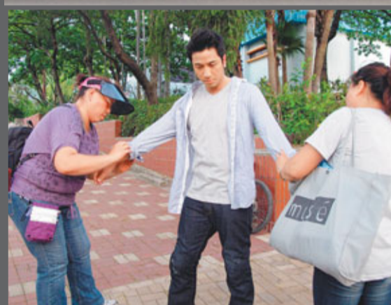
■為免卓羲受傷，工作人員特為他穿上長袖衫以作保護。