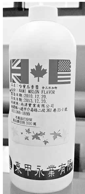
台當局追查含塑化劑的「哈密瓜香醬」，此為麵包原料。衛生局人員將產品查封帶回。

將持續到所有下游網絡都掌握為止，直到確定所有問題產品全部回收，且上架產品都是安全無虞的。他擔心，摻入食品添加物的塑化劑可能還用在其他地方，因此只好鎖定從源頭往下追查，盡量在最短時間內找出問題產品。