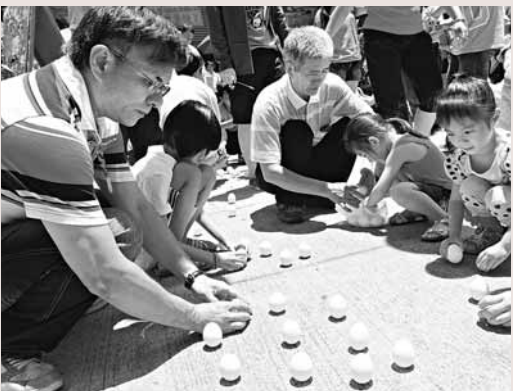
昨日端午節，許多台南市民中午擠爆中西區的五瘟宮廟埕「立蛋」，歡度節慶。

嘉義、彰化等縣2天來接連舉辦龍舟賽，同時合併舉辦地方農漁產品展售、傳統技藝表演，布袋鎮等海濱小鎮人潮不斷。