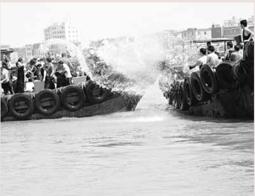
台灣鹿港參訪團一行120多人和石獅鄉親共同潑水狂歡慶端午。

據悉，此次「對渡」，石獅也有一批人前往台灣參加在鹿港舉行的慶端陽文化交流活動，體現兩岸一家親的骨肉情誼。