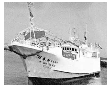
台籍漁船「日春財68號」船長被美軍射殺，船長家屬向AIT表達抗議。

漁權會表示，7日上午將到(AIT)抗議，如果美國態度仍是非常傲慢，或不當一回事，不排除也到台灣「外交部」抗議。