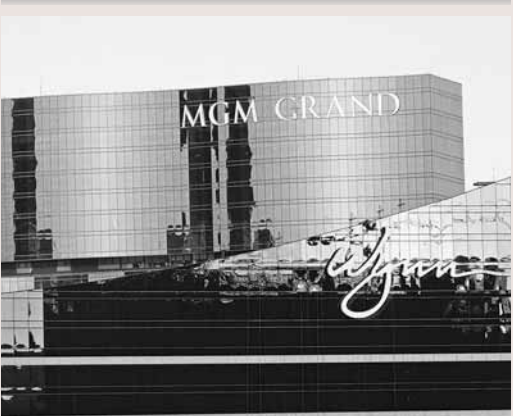
澳門美高梅金殿賭場(上)。

香港文匯報訊 據中央社報道，賭場集團美高梅表示，考慮拓展澳門與台灣市場，台灣博奕一旦合法，將有極大可能到台灣興建賭場酒店。