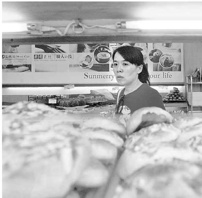
台灣塑化劑風波擴大到麵包、烘焙業，引發民眾恐慌。