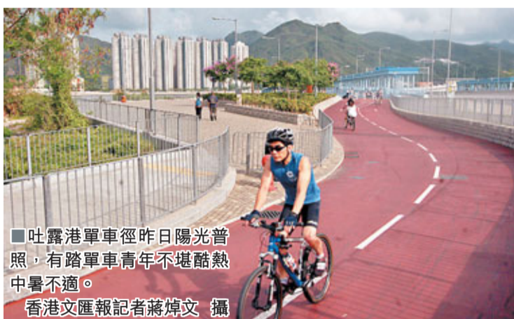
吐露港單車徑昨日陽光普照,有踏單車青年不堪酷熱中暑不適。

香港文匯報訊(記者 杜法祖)端午假期不少市民到野外活動強身健體,惟昨日天氣炎熱,天文台清晨已發出酷熱警告,新界北更錄得逾32℃高溫,最少有3名市民中暑不適。在大埔,有人遠足行山及踏單車時,疑不堪猛烈陽光照射及酷熱,先後中暑不適,其中一名6旬行山漢更一度暈倒,同行友人報警,消防員接報登山將事主救下送院治理。