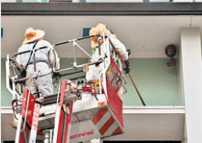
政府總部西座被竹蜂在5樓外牆築巢,穿上防護衣物的食環人員利用升降台雲梯接近蜂巢將之搗毀。