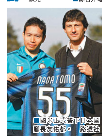
■國米正式簽下日本國腳長友佑都。

國際米蘭將正式簽日本國腳長友佑都。長友佑都去年夏天加盟切辛拿，今年一月國米借用他至陣中，這名「矮腳虎」不負眾望，在13場意甲中攻入2球。國米對他的表現非常滿意，除了他能在競技上幫助球隊外，也能幫助國米開拓日本市場。據悉，國際米蘭將為長友佑都支出700萬歐元。 在轉會市場上，國米肯定不會把全部希望都寄托在一個人身上，最新一個和國米聯繫在一起的左後衛的名字是巴西人巴斯托斯。法國《隊報》傳出的消息確認，巴斯托斯的經紀人將抵米蘭，和國米進行談判，由於此前巴斯托斯的名字一直和祖雲達斯聯繫在一起，因此這一消息的出現有些驚人，國米在這件事情上的保密工作可以說做得相當出色。巴斯托斯的身價大約在1500萬歐元。 ■綜合外電