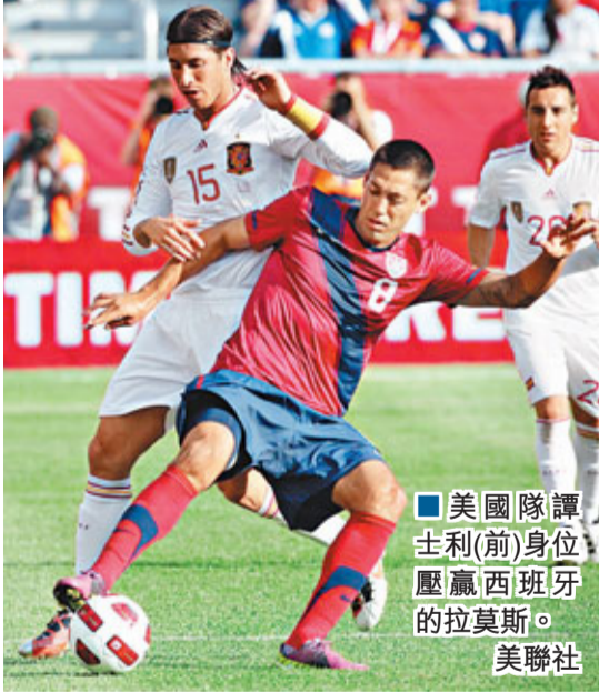
■美國隊譚士利(前)身位壓贏西班牙的拉莫斯。

葡萄牙新帥邊度上任以來，C朗就被任命為隊長，在頭兩場外圍賽他都有入球，葡萄牙起死回生，主帥邊度沒有忘記C朗的功勞：「C朗一直都投入，所有葡萄牙人都應該支持這位世界上最好的球員。他不希望缺席2012年歐國盃這樣的大賽。」 對挪威的比賽，挪威人全力防守，給葡萄牙隊製造了不少的困難。C朗在比賽中遭遇了對方高大後衛的盯防，這次，他沒有入球焦慮症，他展現了自己團結的一面，更多選擇與隊友配合，而不是個人冒險。第52分鐘，波斯迪加終於為葡萄牙破門。下半場，C朗狀態一般，賽後，C朗表示：「在個人入球和球隊勝利之間，我選擇前者。」 作為球隊的隊長，C朗對葡萄牙的貢獻是顯而易見的。各場比賽，他無論攻防都表現積極，顯示了很強的責任心。入球不少，助攻不斷，C朗在場上顯得成熟全面了不少。葡萄牙《紀錄報》稱讚說，9400萬先生在場上控球、突破、怒射、自由球、頭球、防守事事一馬當先，頗有一人包攬黃金一代兩大核心雷哥斯達和費高的氣勢，他要將自己在球會的良好狀態帶到國家隊。小組賽出線不是葡萄牙的終極目標，在歐國盃上有所作為，才是C朗的真正目標。 ■綜合外電