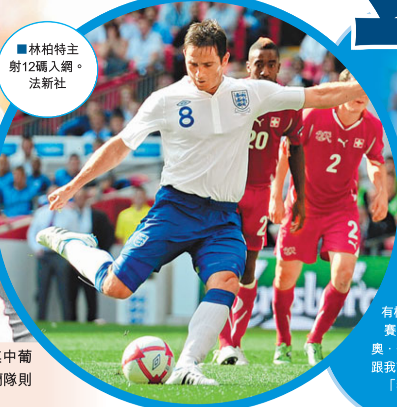
■林柏特主射12碼入網。