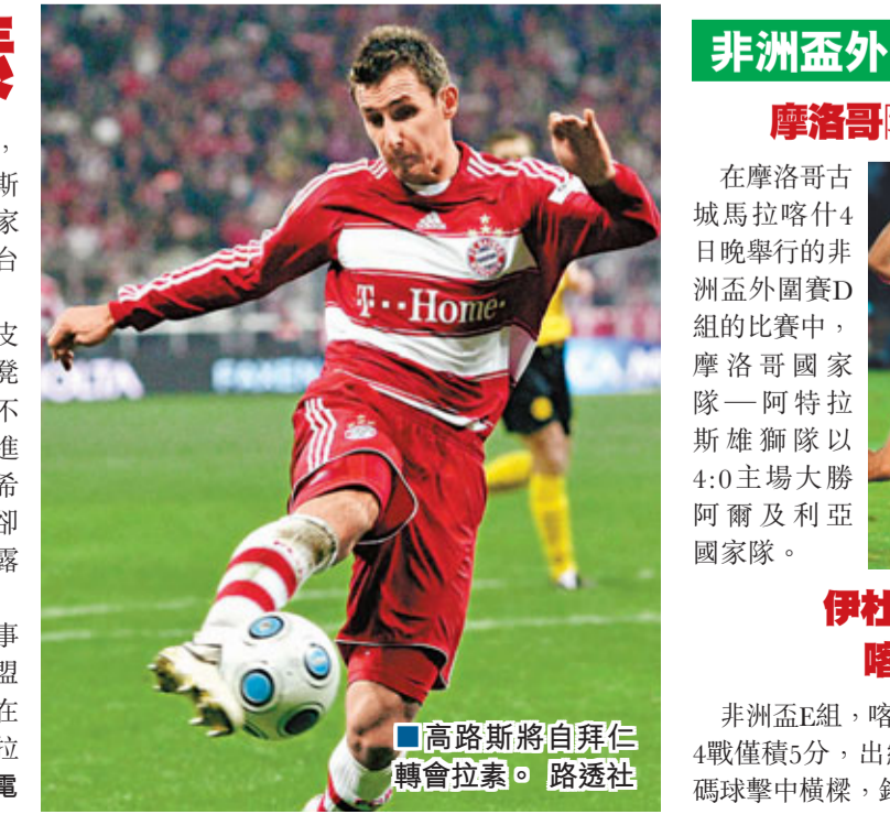
■高路斯將自拜仁轉會拉素。

德國作客戰勝奧地利的比賽中，高路斯沒有出場，而是在場邊的後備席上看着自己在拜仁的隊友高美斯獨自攻入2球並且完成了絕殺，從下賽季開始，國家隊就將成為高路斯和高美斯配合與競爭的僅有平台了，因為高路斯即將正式告別拜仁，加盟拉素。 本賽季結束，拜仁從科特布斯引進了德乙射手王皮特森，這位24歲的新援的到來，也讓原本就坐在板凳席上的高路斯更加沒有出場的機會，因此球會決定不再與高路斯續約，此後歐洲各支球隊都傳出有意引進高路斯，在意甲賽場，祖雲達斯甚至是國米都被爆希望免費簽下高路斯。但最終，成功完成這筆交易的卻是闖進了下賽季歐聯的拉素。《羅馬體育報》就透露高路斯轉會拉素的交易已經接近完成。 作為歐洲的權威媒體，法國的《隊報》披露高路斯加盟拉素已是鐵的事實，「在結束了拜仁的合同之後，高路斯已經和拉素達成協議，他即將加盟拉素，高路斯與拉素簽署了一份為期2年的合同。」據了解，高路斯之所以在眾多強隊中選擇拉素，主要原因是家人更喜歡羅馬城的生活環境，而加盟拉素之後，他的年薪大約在200萬歐元左右。 ■綜合外電