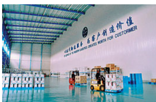
■物流服務業迎來發展新機遇

度發達相互撞擊，火花四射。香港地區是黑龍江省利用境外資金合作起步最早、合作金額最大、合作項目最多、合作成效最為顯著的地區。截至2010年底，黑龍江累計審批香港地區外商投資項目3,015項，合同利用香港地區資金112.1億美元，實際利用香港地區資金78.71億美元，居外資國別（地區）排序首位。2010年，黑龍江省新批香港地區投資項目64項，同比增長33.33%，合同利用香港地區資金12.93億美元，同比增長792.14%，實際利用香港地區資金14.1億美元，同比增長63.55%，居外資國別（地區）排序首位。