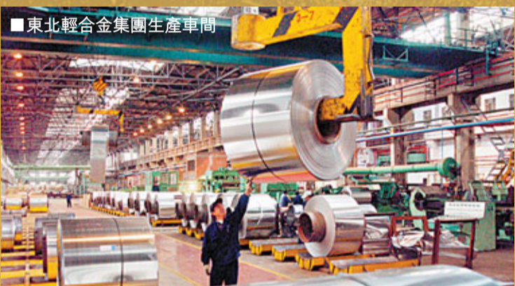
■東北輕合金集團生產車間

「八大經濟區」與「十大工程」不僅承載着黑龍江人富民強省的夢想，更是有識之士投資興業大展拳腳的絕麗舞台！黑龍江這塊沃土，正以她寬廣博大的胸懷，以其無限的發展潛力，無法阻擋的奪目魅力，成為無數已經投資和有意投資者的巨大動力。