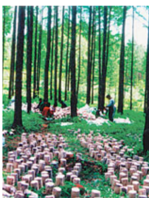
■原生態食用菌生產基地

6月8日 11:00-12:00 2011黑龍江（香港）活動周暨十大重點產業項目推介活動新聞媒體見面會 地點：會展中心舊翼（S428） 12:00-13:00 2011黑龍江（香港）活動周暨十大重點產業項目推介活動新聞媒體午餐會 地點：會展中心舊翼（S229）