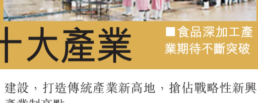
■食品深加工產業期待不斷突破

經濟結構不夠優化，資源優勢沒有得到充分利用，是一直困擾黑龍江省經濟發展的癥結所在，而確定和提出發展「十大產業」，既符合國家產業政策指向，符合市場需求導向，又符合發揮黑龍江省比較優勢。工業項目建設「三年攻堅戰」將以黑龍江哈大齊工業走廊、東部煤電產業帶和各類工業園區為載體，通過技術改造、招商引資、改善環境，全力推進工業項目