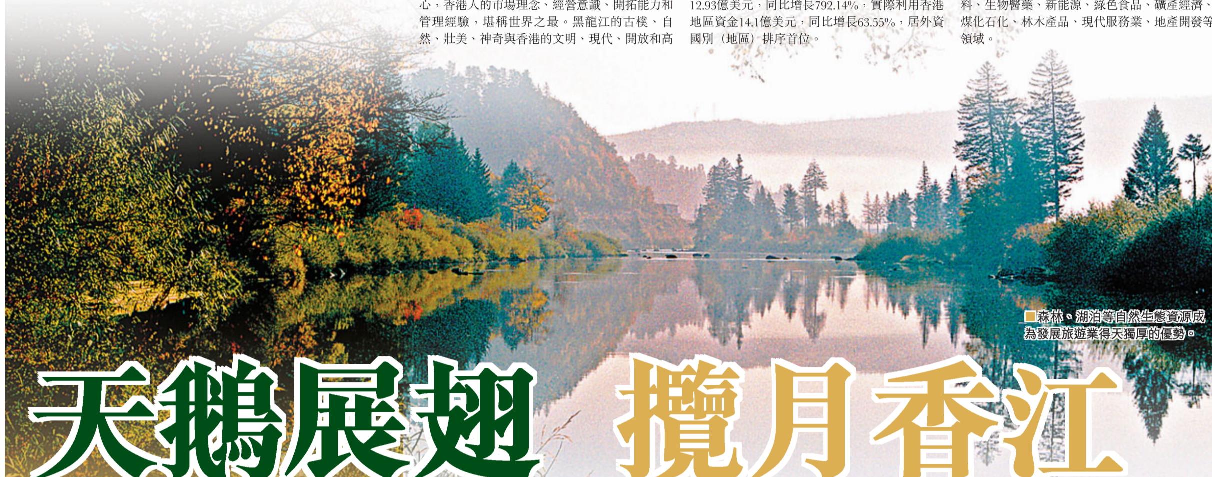
■森林、湖泊等自然生態資源成為發展旅遊業得天獨厚的優勢。

目前，香港地區在該省投資主要集中在新材料、生物醫藥、新能源、綠色食品、礦產經濟、煤化工、林木產品、現代服務業、地產開發等領域。