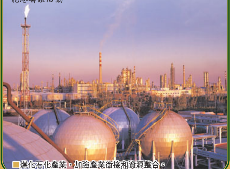
■煤化工產業，加強產業銜接和資源整合。

15:30-19:30 2011黑龍江（香港）活動周暨十大重點產業項目推介會 黑龍江—香港產業項目合作簽約儀式 龍港聯誼活動