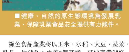
■健康、自然的原生態環境為發展乳業、保障乳業食品安全提供有力條件。

新型農機裝備製造將圍繞動力機械、新型農機具和農產品加工機械，重點打造哈爾濱、齊齊哈爾、佳木斯農機等6個產業園區。交通運輸裝備製造業，圍繞哈飛、哈東安、北車集團齊齊哈爾交通公司等重點主機企業，依托大慶沃爾沃、穆稜江蘇大車集團電動車等重點項目，着力建設哈爾濱、大慶、齊齊哈爾的飛機、汽車和軌道交通產業園區。