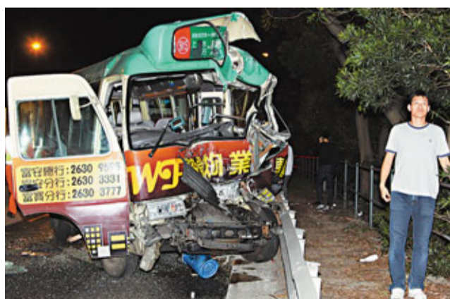
獅子山隧道公路車禍中，肇事專線小巴車頭損毀嚴重。

香港文匯報訊(記者 杜法祖)獅子山隧道公路昨凌晨發生小巴相撞意外，一輛通宵線公共小巴，行駛途中疑擱拋錨停泊路旁，尾隨一輛專線小巴駛至，疑收掣不及及失控狂撼拋錨小巴車尾，釀成19人受傷，獅隧公路入新界方向受事件影響一度擠塞。警方現正調查肇事原因。