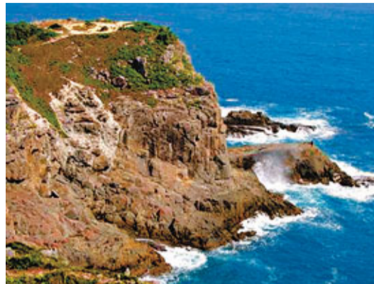
東龍島是攀石的好去處。

傷者年約20餘歲，報稱大學生，據悉已有近3年的攀石經驗，每逢假日均會作攀石活動，東龍島不少石崖已被其「征服」。豈料昨午失手險送命，意外中其右手及腰部受傷，經治療後無大礙。