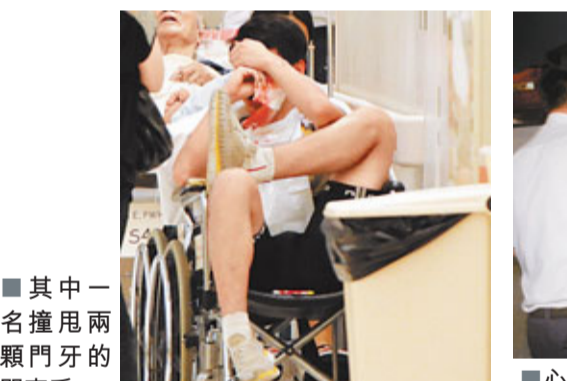
其中一名撞甩兩顆門牙的單車手。

香港文匯報訊(記者 杜法祖)香港單車聯會昨晨在沙田科學園舉行單車比賽期間發生意外，青年組進行18公里繞圈賽事期間，疑因有車手「扒頭」釀成10車連環相撞，有4名車手受傷，經在場救傷隊員治理後，其中2人須送院。其中1名受傷入院車手價值5萬元「戰車」撞毀，形容「肉赤」多過「肉痛」。