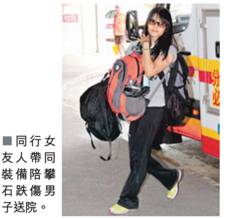
同行友人帶同裝備陪攀石跌傷男子送院。

現場消息稱，事主昨晨偕同友人一行多人，由西灣河乘坐渡輪往東龍島，到島上東北方一處懸崖進行攀石活動。期間當事人沿著繩索，爬至石崖離地約7、8米高時，疑一時滑手，整個人頓凌空墮地擦傷右手、腰部亦撞傷，幸傷勢並不嚴重，友人見狀馬上替其包紮手部傷口，並陪同事主乘坐渡輪回程及報警。救護車接報到西灣河嘉亨灣旁的渡輪碼頭接船，將事主送往東區醫院救治。