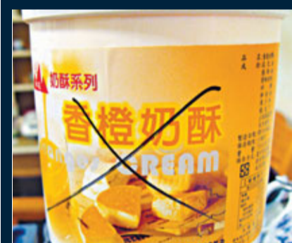
■嘉義市天新食品生產的「香橙奶酥」含有塑化劑。中央社

香港文匯報訊 據中央社報導，食品添加塑化劑風波越演越烈，台「教育部」官員昨日表示，從小學到大學，將配合「衛生署」的政策，將相關產品下架，17日前由督學、食品相關學系學校等，全面清查各級學校校內食品。