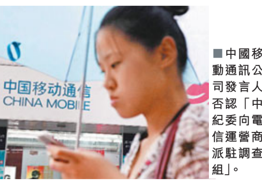
■中國移動通訊公司發言人否認「中紀委向電信運營商派駐調查組」。

從2009年9月至今，中國移動已有7名中層官員落馬。今年5月份，中國移動數據部副總經理馬力，中國移動原