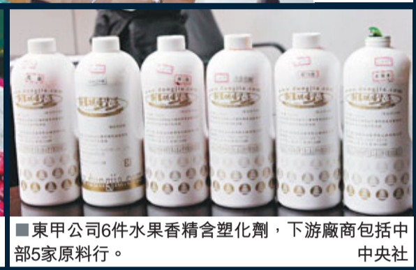
■東甲公司6件水果香精含塑化劑，下游廠商包括中部5家原料行。