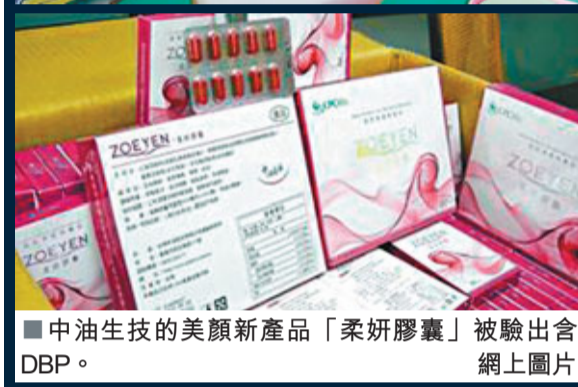
■中油生技的美顏新產品「柔妍膠囊」被驗出含DBP。網上圖片