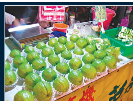
■攤檔老闆表示，水果在塑化劑風暴後價飆，其中番石榴漲了4至5倍。網上圖片

香港文匯報訊（記者 古寧 廣州報導）繼廣州家樂福、百佳超市表示對涉及塑化劑污染的3種台灣食品進行下架、封存後，廣州沃爾瑪、好又多、華潤萬家等超市日前也表態，對已售出的相關食品接受退貨。