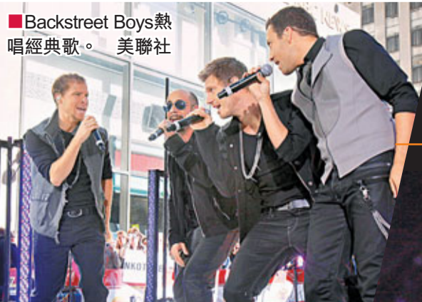
Backstreet Boys熱唱經典歌。