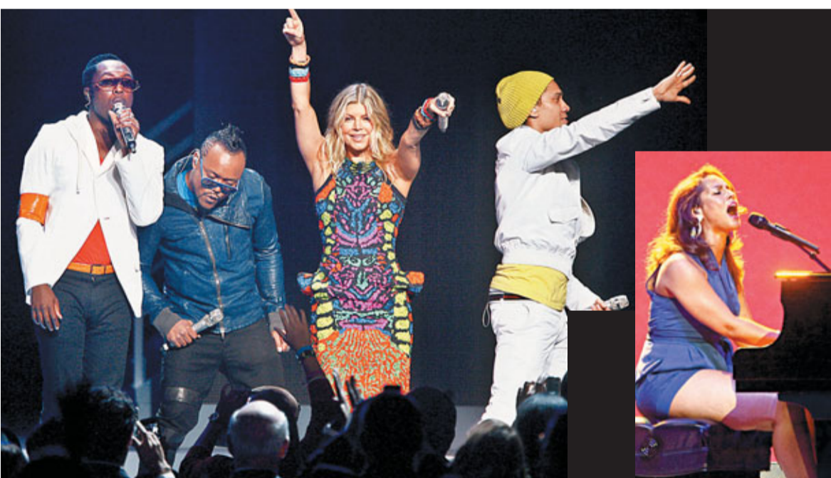
Black Eyed Peas 勁歌熱舞，炒熱現場氣氛。

Fergie透露隊友們都知道她一直渴望有個悠長的假期，與演員丈夫佐殊杜夏姆(Josh Duhamel)有些私人時間，還稱她與丈夫都是對方的忠實粉絲。她又爆料自己一直夢想推出個人專輯，當初會加入黑眼豆豆是因為可以提升自己的歌藝，而且跟着隊友一起巡迴，可以增廣見聞，令唱歌更有感情。她稱自己早已如實跟隊友們報告其想法，因此他們感情一直很好，沒有爭執。 ■文：Mana