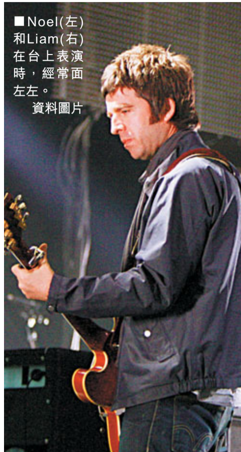
Noel(左)和Liam(右)在台上表演時，經常面左左。資料圖片

90年代雄霸樂壇的英倫搖滾組合Oasis，因創作主腦兼首席結他手Noel Gallagher與主音胞弟Liam Gallagher意見不合，勢成水火，去年8月Noel私自離隊，Oasis因而解散，兩兄弟亦斷絕來往。不過，Noel日前宣佈與多年女友Sara MacDonald結婚，其母Peggy下旨勒令Liam除非雙腳齊斷，不然一定要出席兄長婚禮。