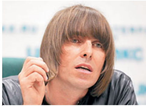
Liam Gallagher在俄羅斯演出時，接受當地傳媒訪問。