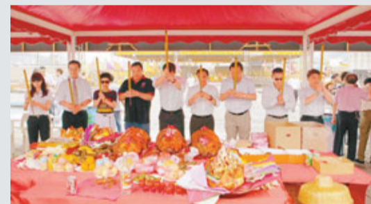
澳門國際龍舟賽舉行祈福儀式。

香港文匯報訊(記者 林婉琪 澳門報導)「2011澳門國際龍舟賽」於昨日起，一連3日在南灣湖水上活動中心舉行。為祈求每年一度的龍舟競渡可以順利進行，賽事籌委會前日中午在南灣湖水上活動中心舉行祈福儀式。