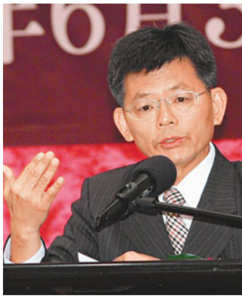
楊秋興認為港台關係應更為密切。

香港文匯報訊(記者 解玲)受中國評論通訊社之邀來港的台灣前高雄縣縣長楊秋興，前日出席首屆「港台關係影響力論壇演講餐會」時指出，港台關係應更為密切，而由於過往缺乏關注，兩地關係未得到相應發展，他強調香港在經濟發展、行政治理和社會建設等多方面的優勢，皆值得台灣借鏡，冀未來台灣更加開放、港台兩地更緊密合作，以利更大發展。