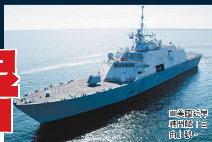
美國近岸戰鬥艦「自由」號。

美國債務和財赤嚴重，伊拉克和阿富汗戰爭為國庫帶來沉重壓力，加上軍費被削、民眾厭戰，不少分析認為美國的軍事影響力將會下降。但本月底離職的美國國防部長蓋茨昨日堅稱，債務等問題不會阻礙美國在環太平洋加強軍事存在，並會以一連串武器計劃，應對所謂的「阻止美軍進入重要海路」的力量。分析認為，蓋茨的高調宣言，是要安撫它的亞洲「盟友」。