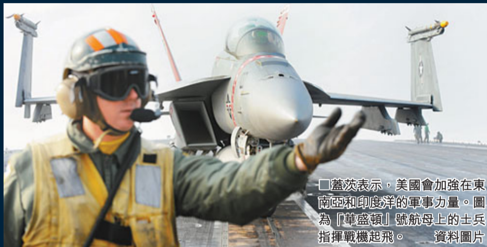
蓋茨表示，美國會加強在東南亞和印度洋的軍事力量。圖為「華盛頓」號航母上的士兵指揮戰機起飛。

美國債務和財赤嚴重，伊拉克和阿富汗戰爭為國庫帶來沉重壓力，加上軍費被削、民眾厭戰，不少分析認為美國的軍事影響力將會下降。但本月底離職的美國國防部長蓋茨昨日堅稱，債務等問題不會阻礙美國在環太平洋加強軍事存在，並會以一連串武器計劃，應對所謂的「阻止美軍進入重要海路」的力量。分析認為，蓋茨的高調宣言，是要安撫它的亞洲「盟友」。