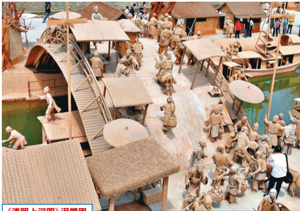
《清明上河圖》泥塑園 泥塑園3日在河北省唐山市豐潤區常莊鄉麻龍灣建成並正式對外開放。泥塑園長300米、寬62米，由多名民間泥塑高手花費4年時間製作完成。整個泥塑園中有400多個形態各異的人物、20隻牲畜、20條船和30間宋代民居以及橋樑、城樓等泥塑作品。圖為遊客在《清明上河圖》泥塑園中遊覽。

中國物流與採購聯合會副會長蔡進分析指出，5月份商務活動指數較上月只是小幅回落，非製造業仍處高位運行。這其中，建築裝飾業和房屋及土木工程建築業表現依然強勁，此外，旺季效應帶動零售業表現良好，但其指數水平較歷史同期有所降低，「顯示在通脹壓力下，居民消費趨於謹慎」。