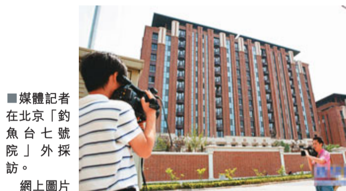
■媒體記者在北京「釣魚台七號院」外採訪。

香港文匯報訊（記者 劉曉靜 北京報導）自媒體曝光北京「釣魚台七號院」每平方米售價高達30萬元人民幣或涉嫌暴利以來，「釣魚台七號院」就吸引了社會所有目光，而北京市住房和城鄉建設委員會3日表示，已暫停該項目23套定價過高房屋的銷售，並對該項目展開調查。