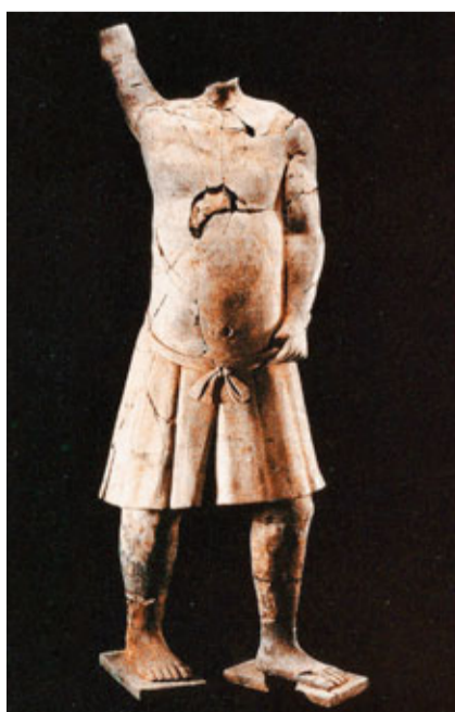
■當年試掘「百戲俑坑」出土的其中一件戲俑。

他透露，由於當時試掘面積不及整個俑坑面積的十分之一，K9901號陪葬坑的形製、內涵、所包含的