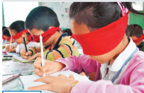
體驗視障 為迎接6月6日「全國愛眼日」，江西婺源紫陽三小開展「蒙眼體驗視障 珍愛心靈之窗」主題活動。3日，在婺源紫陽三小，學生蒙着眼睛寫字，體驗視障的不便。新華社

一位內部人士稱，統計局辦公室和央行研究局的一些人員已經相繼離職。不過，對於是否追究涉事券商的責任仍未有定論，而且這些機構一般都是通過中間人收買資料，比較容易撇清關係。