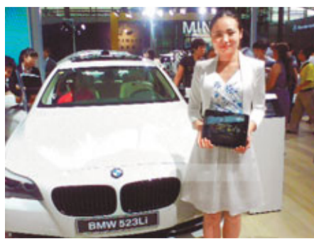
寶馬汽車銷售人員均配iPad向客戶展示汽車價格、性能等。

香港文匯報訊(記者 李昌鴻 深圳報導)展覽面積達11萬平方米的為期六天的「2011深港澳國際汽車展」昨日開幕,包括奔馳、寶馬、奧迪、上海通用、比亞迪等20多家廠商積極參展,共推出30多款新車。奔馳、寶馬、奧迪和卡迪拉克等豪華車在深圳銷售出現高達3成以上的快速增長,其中奔馳和寶馬去年在深圳的銷售分別達近萬輛和6000輛。