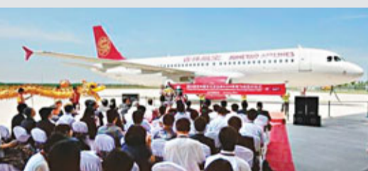
圖為交付給中國吉祥航空公司的第50架空客A320飛機。

據了解,這是今年交付的第13架飛機,客戶為中國吉祥航空公司。今年內,空客還將繼續向中國航空公司交付23架天津總裝的A320系列飛機。預計到「十二五」末,空客天津總裝線將達到年產319、320、321系列飛機48架,成為亞洲第一的總裝製造和維修基地。