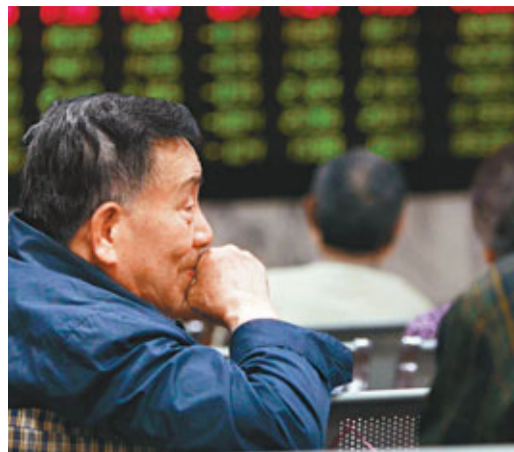
滬股創下4個月的盤中新低。 資料圖片