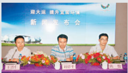
迎大運提升宜居環境新聞發佈會現場。

香港文匯報訊(記者 羅珍,特約通訊員 龍軒、李瓊芳、袁文彪 深圳報導)第26屆世界大學生運動會將於8月12日在深圳舉行,深圳市龍崗區2日召開了「迎大運提升宜居環境」新聞發佈會,為了展現美好的河流環境,該區投資6.9億元,治理龍崗河幹流,該項目將於本月底完工。