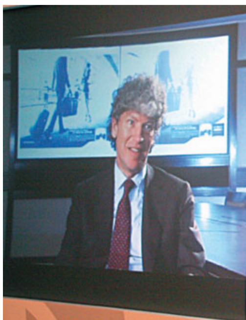
■新秀麗國際主席兼行政總裁Tim Parker以視像會議介紹招股詳情。

新秀麗是於1910年成立的旅行箱生產商,至今已滿100周年,其股票代碼1910亦正與其成立年份一致,意在慶祝集團成立100周年。旗下擁有「新秀麗」和「American Tourister」兩個品牌。據其招股書指出,亞洲是集團盈利能力最高的地區,區內中國、印度和韓國都是集團的主要市場所在地,集團2010年於亞洲的銷售淨額為4.051億美元,佔銷售淨額總額的33.3%,較