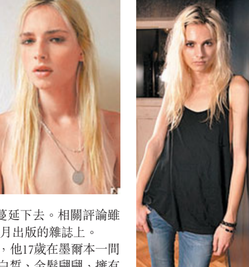
兩張照片可見佩伊奇酷似女性。