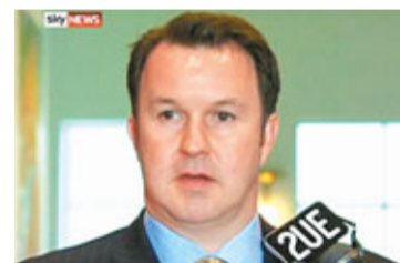
布什比在國會發出「喵」聲，引發罵戰。

澳洲國會昨日爆發罵戰，華裔女財長黃英賢炮轟反對黨性別歧視及搞「校園政治」，又指責反對黨黨魁阿博特經常作出令人反感的言論。多位執政黨議員附和，稱反對黨的行為不負責任，直指阿博特帶領一群性別歧視的「蠢蛋」黨員；反對黨亦不甘示弱，反指執政黨也作人身攻擊，形容執政黨虛偽。