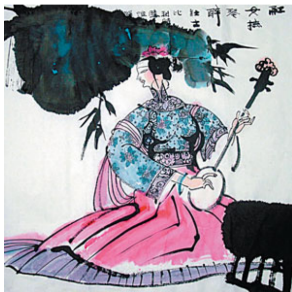
油畫中也可以注入古代仕女等中國式元素。