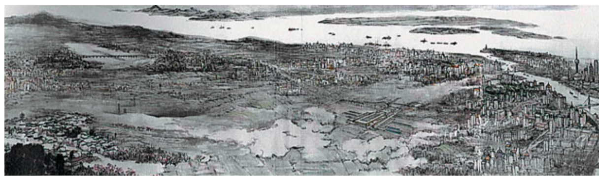
國畫這樣高純度的傳統繪畫風格，時至今日仍舊是收藏界主流。

第6屆亞洲國際藝術古董展，日前在港舉行，並連帶引動了延續其後的一系列春季拍賣會。古董藝術的營商平台綻放香港自然是如魚得水，但今次我們的關注視角卻是想從煩囂的市場價值層面跳脫出來，來細讀其背後的文化智慧。藝術品的價值在內行收藏家眼中，當然首先建基於有否升值潛力，但時代的推進其實也在潛移默化革新着我們的欣賞眼光。特別是中國書畫、油畫、書法雕刻等蘊含了濃厚傳統價值的藏品，更不能剝離出整個華夏文明的語境去單獨審視。倘若我們能夠懷抱一點點耐心、一點點好奇，去理解其中的一兩件作品，或許就會打開文化認同的一扇門，為原先的審美帶來衝擊，甚至是提升。我們以這種見微知著的心情，與兩位藝術收藏業資深專家展開探討。他們從藝術創作本身和館藏兩個不同角度，為我們對這一課題的理解，帶來了一些啟發。