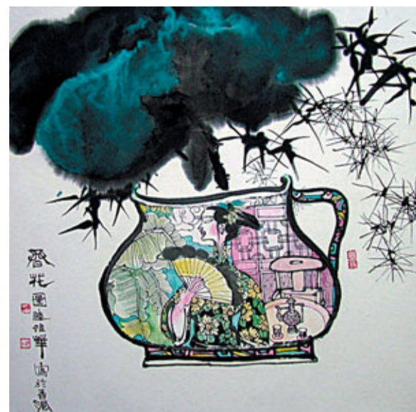
在平面上塗抹藝術火花的繪畫，更像一場藝術苦旅。