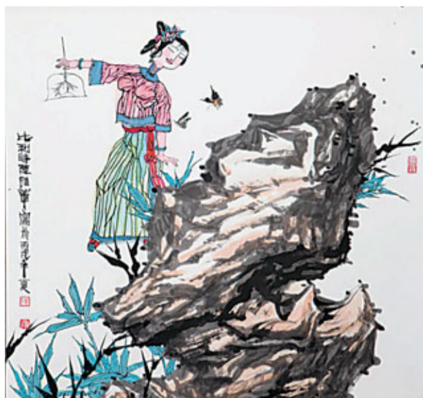
最東方的審美觀，令西方讚嘆。