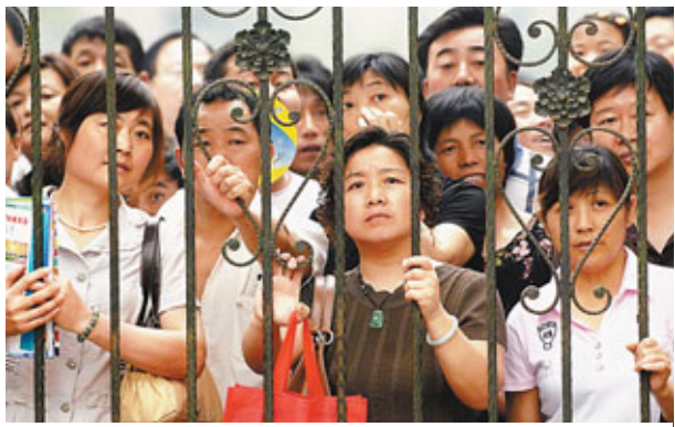
■子女在考場內作戰，父母則在外緊張地守候。 資料圖片

香港浸會大學中國研究課程成立於1989年，至今已培養近兩千名本科生，為香港歷史最悠久的中國研究課程。香港文匯報與浸大中國研究課程合作推出通識專欄，以專業的角度，深入地探究中國在社會民生、城市規劃、經濟轉型、外交政策等多方面的最新發展，為本港高中生提供具權威性的「現代中國」通識科單元學習材料。