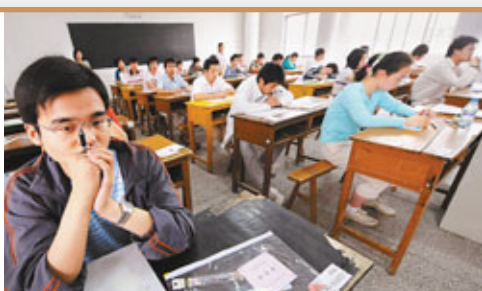
■中國的高考制度保證全國各地的青年才俊可持續不斷地進入大專院校深造。圖為考生正在一考場內等待開考。

高考可謂國之公器，攸關文化之存續和社會之穩定，其每項調整和變化都影響萬千學子的命運，關係到國家的科教事業和發展戰略。雖然現在社會提供很多進步的機會，但眾多優秀學子還要闖過高考這座「獨木橋」才有光明前途，故與高考相聯繫的「自主聯合招生」是非常有必要的，也是將傳統高考制度納入素質教育體系的必由之路。