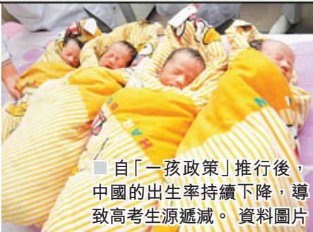
■自「一孩政策」推行後，中國的出生率持續下降，導致高考生源遞減。