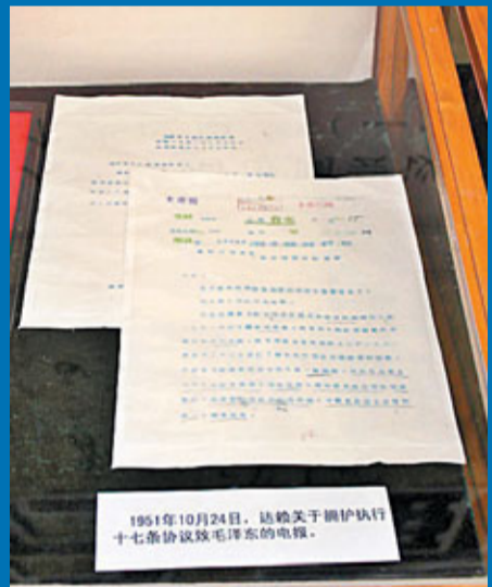
1951年10月24日，達賴關於擁護執行十七條協議致毛澤東的電報。