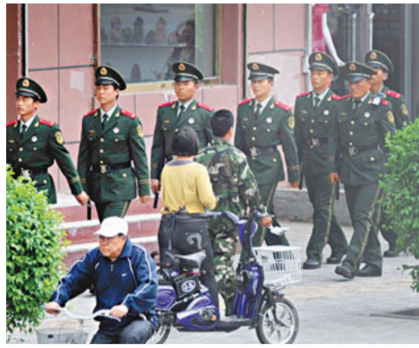
警察在錫林郭勒盟市面巡邏。

文章還指出，中國社會的矛盾多發越來越明顯，少數民族地區也處於社會轉型的大潮流中，中國社會應理性看待邊疆民族地區發生的各種事情，既不誇大它們的政治含義，又要直面它們，關注每一起事件背後的深層原因，認真、豁達地處理好它們。