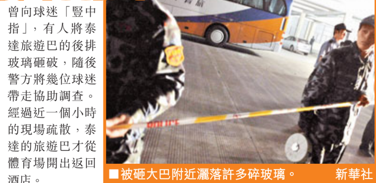
被砸大巴附近灑落許多碎玻璃。

香港文匯報訊(記者 陳曉莉) 中國足球超級聯賽(中超)29日晚再發生球場不愉快事件。主場作戰的杭州綠城因終場前被對手天津泰達以2:1反勝，引起主場球迷不滿。賽後，現場流傳泰達球員於大寶