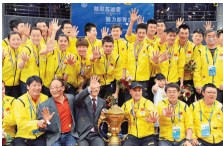
國羽上下伸出五個手指，目標五連冠。

29日晚，中國國家羽毛球隊以3個2:0橫掃丹麥隊，第八次捧起蘇迪曼盃。在中國人沉浸在歡慶之夜的同時，世界羽球運動卻在漫漫長夜中躊躇前行。