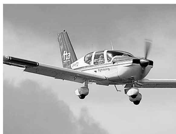
發生無人駕駛事件的同類型飛機。

澳洲發生離奇的航空事故，一名年輕訓練機師在機上不省人事55分鐘，其間飛機無人駕駛250公里，向着茫茫大海飛去。幸好機師最終及時回復知覺，否則勢將命喪大海。