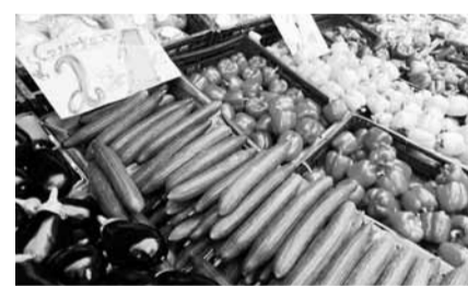
柏林超市銷售的各式蔬菜。

歐洲爆發腸出血性大腸桿菌疫情至今已逾2周，俄羅斯昨日宣布，禁止所有德國和西班牙的蔬菜入口，並指若情況持續，便會禁制歐洲所有蔬菜。香港衛生防護中心表示，已聯絡世界衛生組織(WHO)及德國當局了解事態發展，呼籲市民進食前要做徹底煮熟食物，外遊德國時避免在當地進食生番茄、青瓜或蔬菜沙律。