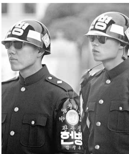
韓朝關係再現緊張氣氛。圖為駐守在邊界的韓國士兵。