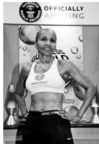
現年74歲的美國祖母謝潑德太太(見圖)擁6塊腹肌，是健力士最年長女性健身運動員保持者，她目前擔任健身教練，閒時也會當模特兒，展示苦練得來的肌肉。過去18年，她參加過9次馬拉松及贏得2次健美比賽。謝潑德太太每天清晨3時起床，先打坐冥想，然後在附近公園跑10英里，才進食午餐。她的菜單健康又簡單，1天3餐，包括糙米、雞胸肉、蔬菜及一杯生雞蛋。 ■《每日郵報》