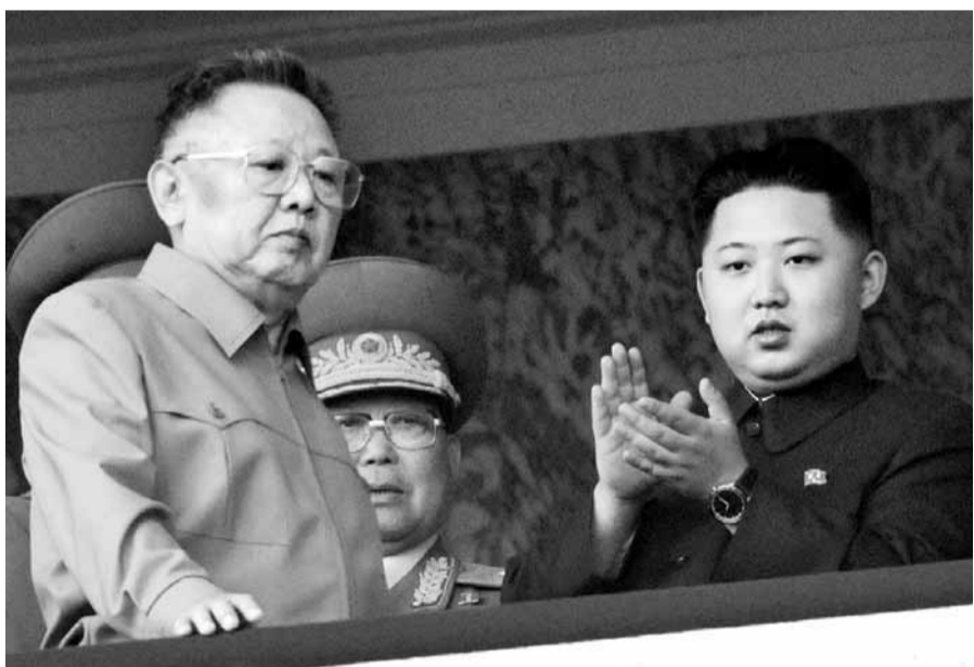
加入親朝鮮網絡的士兵，據稱宣誓效忠金正日(圖左)和金正恩。