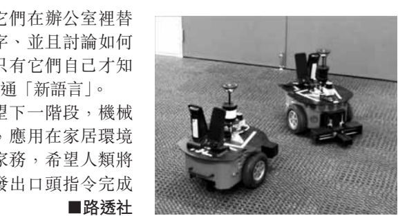
通、互相聯絡。它們在辦公室裡替不同地方取新名字，並且討論如何避開雜物，建立只有它們自己才知曉、日後溝通的共通「新語言」。項目負責人希望下一階段，機械人能夠握住物件，應用在家居環境中幫助人類處理家務，希望人類將來只需向機械人發出口頭指令完成任務。

研究人員形容這些機械人是「配上車輪的手提電腦」，它們配備聲納、攝影機、激光測距儀、麥克風及喇叭，在活動時會以電子聲音溝