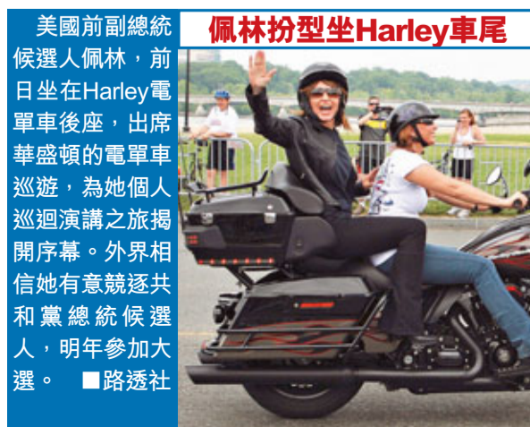
美國前副總統候選人佩林，前日坐在Harley電單車後座，出席華盛頓的電單車巡遊，為她個人巡迴演講之旅揭開序幕。外界相信她有意競逐共和黨總統候選人，明年參加大選。