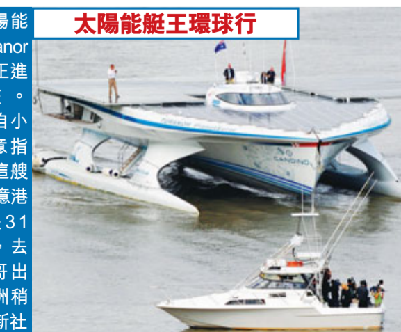
全球最大太陽能推動船隻「Turanor PlanetSolar」正進行環球之旅。

「Turanor」出自小說《魔戒》，意指「太陽力量」。這艘遊艇花費約1.4億港元建成，全長31米，可載40人，去年9月從摩納哥出發，目前在澳洲稍作停留。