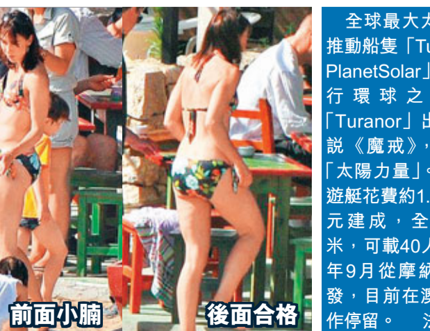
前面小胸 後面合格