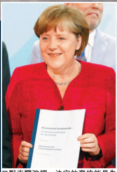
默克爾強調，決定放棄核能是為了追求更安全可靠的新能源。

日本福島核災難使全球反核聲音高漲，擁有17座核反應堆的德國，上周末再有數萬人舉行反核示威。面對群情洶湧，早前因支持核能而在地方選舉大敗的總理默克爾領導的執政聯盟，經12小時磋商後，昨宣布於2022年前徹底放棄核能發電，成為福島核災難後，首個放棄核能的工業大國。默克爾表示，放棄核能是要追求更安全可靠的新能源。