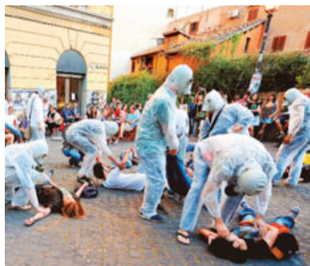
意大利反核分子召集「快閃黨」上演「扮死」街頭劇。