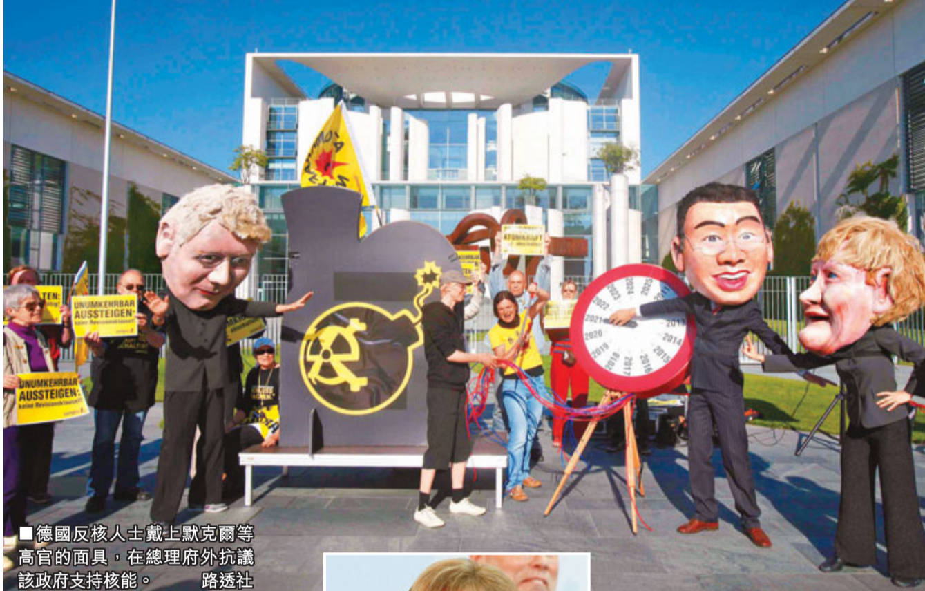
德國反核人士戴上默克爾等高官的面具，在總理府外抗議該政府支持核能。

日本福島核災難使全球反核聲音高漲，擁有17座核反應堆的德國，上周末再有數萬人舉行反核示威。面對群情洶湧，早前因支持核能而在地方選舉大敗的總理默克爾領導的執政聯盟，經12小時磋商後，昨宣布於2022年前徹底放棄核能發電，成為福島核災難後，首個放棄核能的工業大國。默克爾表示，放棄核能是要追求更安全可靠的新能源。