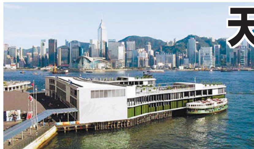
天星小輪提出活化碼頭計劃，回復昔日舊貌，並設立展館。設計圖片

香港文匯報訊(記者 羅敬文)天星碼頭在尖沙咀屹立逾半世紀，營辦渡輪服務的天星小輪提出活化碼頭計劃，提出回復昔日舊貌，又設立展館介紹維港海外線多年來的變化，並在天台近岸位置加建1層，以供餐飲零售設施，既可為小輪公司提供額外非票務收入，亦可遷港於民，讓遊人飽覽維港景致。 海濱事務委員會轄下的專責小組今日召開會議，商討天星小輪提出的活化復修碼頭計劃。天星小輪提交的文件指出，尖沙咀天星碼頭是