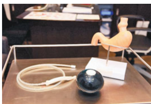
胃內水球是由矽膠製造，體積約500-600cc，以內窺鏡放入胃部，療程完成後再取出。

香港文匯報訊(記者 文森)香港中文大學早前研究胃內水球的療效，119名BMI超過25的本地肥胖人士，於接受胃內水球治療後，多餘體重的平均跌幅達45%，血壓及膽固醇水平亦改善，同時發現胃內水球不單有效減重，降低肥胖對健康的相關風險，另可改善情緒、精神健康等生活質素。外科專科醫生指出，由於胃內水球以改善飲食習慣為前提，所以即使於療程完結後取出水球，其體重的反彈比率仍較減肥藥為低。