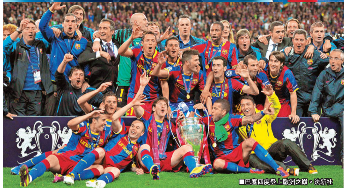
■巴塞四度登上歐洲之巔。