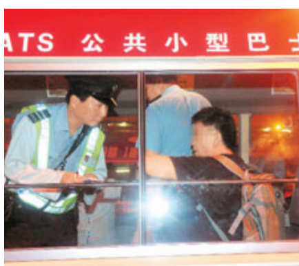
■警員在公共小巴上向被人投訴打人的男乘客調查。