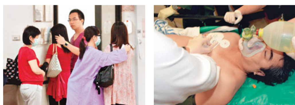
■死者多名家人及親友趕到醫院神情哀傷。