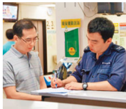
■死者胞弟趕到醫院了解情況。