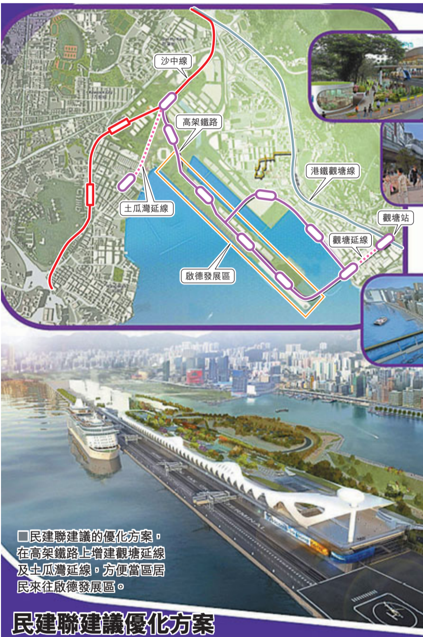
■ 民建聯建議的優化方案，在高架鐵路上增建觀塘延線及土瓜灣延線，方便當區居民來往啟德發展區。

陳鑑林又指出，分區計劃大綱圖上建議興建的啟德至觀塘「雙用」大橋，將可讓行人及高架鐵路更直接及快捷地來往郵輪碼頭及觀塘海濱一帶，其獨特的大橋設計亦可成為整個東九龍的新地標，吸引遊客，建議當局盡快興建。他表示，將於短期內將計劃及訴求提交發展局作討論。