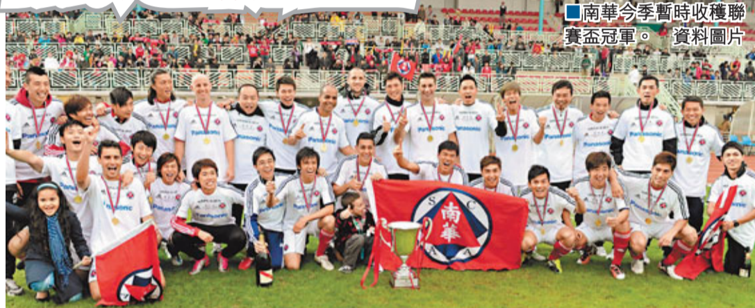
南華今季暫時收穫聯賽盃冠軍。資料圖片