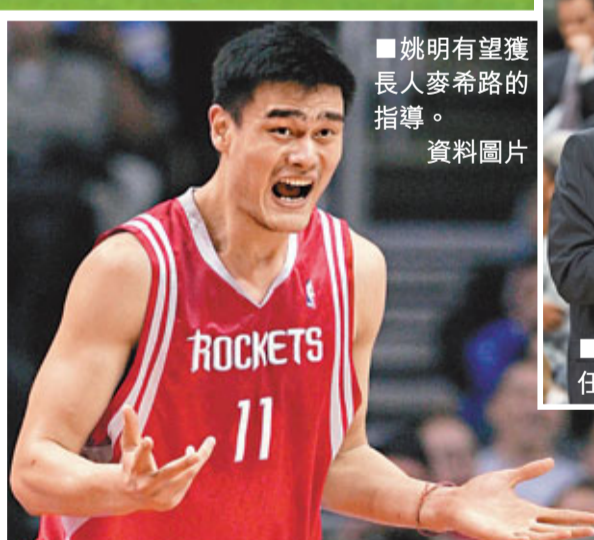
姚明有望獲長人麥希路的指導。資料圖片