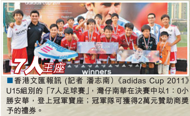
7人王座 winners 香港文匯報訊（記者 潘志南）《adidas Cup 2011》U15組別的「7人足球賽」，灣仔南華在決賽中以1:0小勝安華，登上冠軍寶座；冠軍隊可獲得2萬元贊助商獎券的禮券。

香港文匯報訊（記者 潘志南）甲一常規賽冠軍永倫(圖黃衫)在昨晚季後賽4強旗開得勝，以85:71贏飛鷹；而南華在另一場以77:72挫福建。