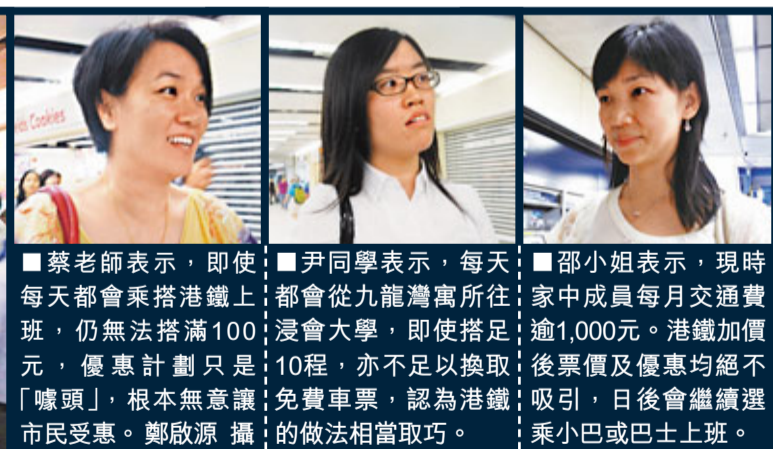
蔡老師表示,即使每天都會乘搭港鐵上,仍無法搭滿100元,優惠計劃只是「噱頭」,根本無意讓市民受惠。尹同學表示,每天都會從九龍灣寓所往浸會大學,即使搭足10程,亦不足以換取免費車票,認為港鐵的做法相當取巧。 邵小姐表示,現時家中成員每月交通費逾1,000元。港鐵加價後,優惠計劃只是「噱頭」,日後會繼續選乘小巴或巴士上班。