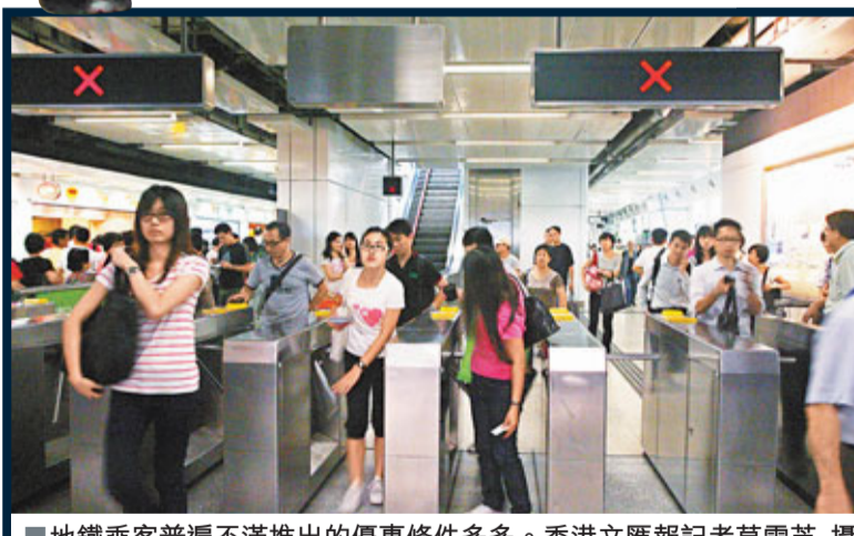
地鐵乘客普遍不滿推出的優惠條件多多。