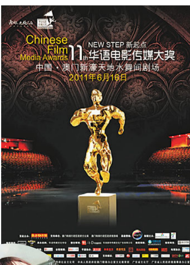
■第11屆「華語電影傳媒大獎」頒獎典禮今年首次在澳門舉行