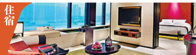
■Banyan Tree Macau酒店房間設計獨特

閒、度假設施。設計獨特的住宿環境、琳瑯滿目的餐飲設施、新鮮刺激的娛樂體驗、舒適自在的休閒享受，令人恍如置身於東南亞的度假勝地，加上員工殷勤的服務態度，「澳門銀河」必能令您充分感受到貼心和無微不至的感覺。