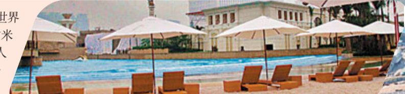
■天浪淘園把賓客帶到一個充滿熱帶風情的世外桃源

「澳門銀河」最令人矚目的設施是天浪淘園，那裡設有全世界最大規模的空中衝浪池，以及以350噸白沙鋪成、佔地4,000平方米的人工沙灘使人驚嘆。天浪淘園內還設有數個泳池、花園，及私人池畔小屋。此外，還有珠江三角洲首家悅榕SPA，這家佔地3,400平方米的悅榕SPA，為悅榕酒店度假村集團旗下最大型的一家。