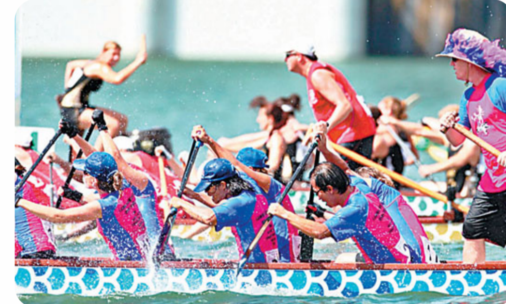
■健兒們齊心合力奮勇前進