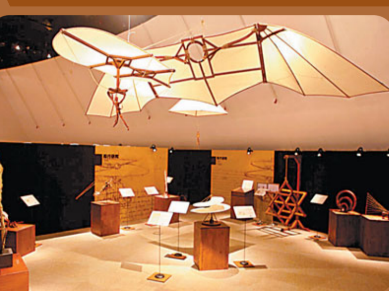
■「超越500年的科學構想，達文西」帶您探索神秘國度