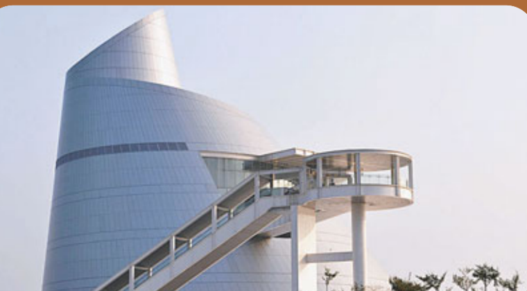
■達文西特備展覽現已於澳門科學館隆重展出

達文西，一位活躍於15世紀歐洲文藝復興時期的曠世奇才。他神秘而充滿傳奇的一生，至今仍讓世界各地的歷史學家及藝術家深深著迷。澳門科學館於即日起至7月31日在展覽中心2號展廳舉辦名為「超越500年的科學構想，達文西」特備展覽，讓公眾探索達文西神秘的科學夢想國度。