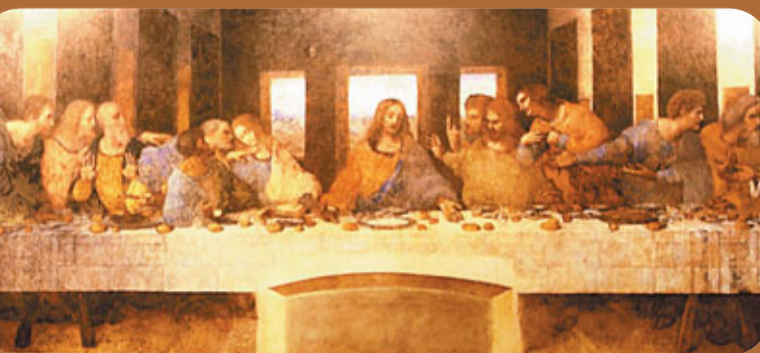
■達文西作品「最後的晚餐」