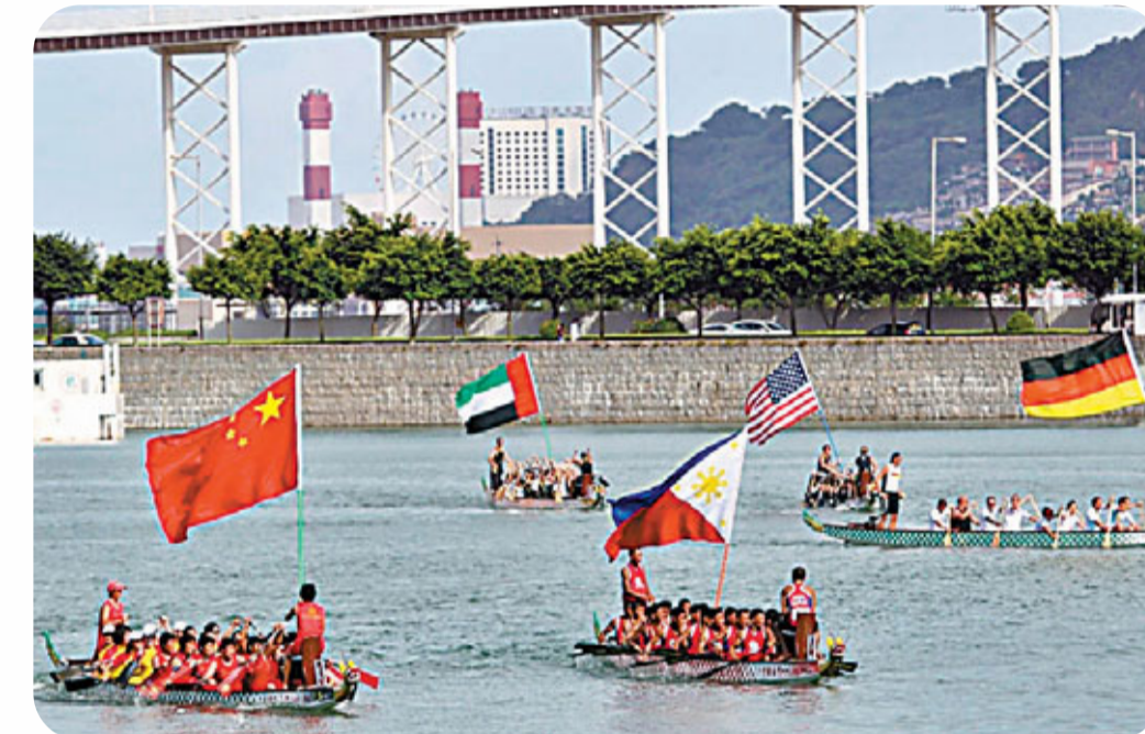
■每年一度的澳門國際龍舟賽於6月4、5、6日在南灣湖水上活動中心舉行。