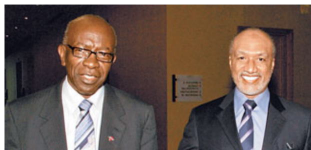
■哈曼(右)與華納(左)兩周前曾見面。

就在國際足聯(FIFA)主席白禮達要在6月1日的主席選舉中角逐連任前夕，FIFA昨晚宣布，白氏的競爭對手、亞洲足聯主席哈曼以及FIFA副主席華納涉嫌行賄，FIFA道德委員會方面已就事件展開調查。