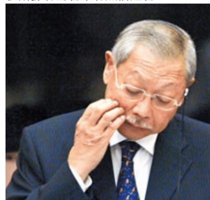
孫明揚昨出席立法會會議，並主動會見傳媒，公開就僱建事件道歉。