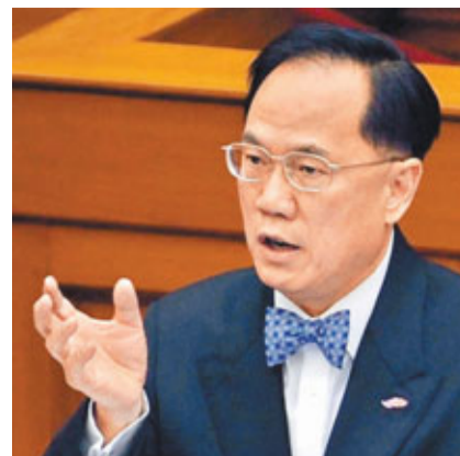
特首曾蔭權敦促問責官員，各自檢視所擁有的物業有無僱建物。