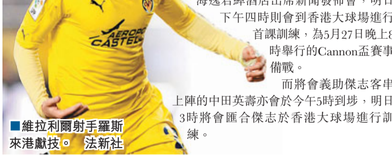
維拉利爾隊手羅斯來港獻技。

而將會義助傑志客串上陣的中田英壽亦會於今晚5時到港，明日3時將會匯合傑志於香港大球場進行訓練。