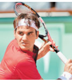
費達拿晉級遇到些少麻煩。