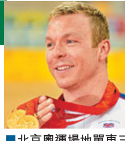
北京奧運場地單車三面金牌得主英國選手克斯·霍伊。

他還說，體育運動可以改變一個民族，英國將把握倫敦奧運會的契機，為這個國家創造更多「奧運遺產」，這種遺產不僅是獎牌數量，更重要的是運動員、裁判員以及工作人員積累下來的經驗。英國還將放眼2016年及以後的奧運會，爭取獲得更多輝煌。