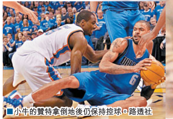
小牛的贊特拿倒地後仍保持控球。