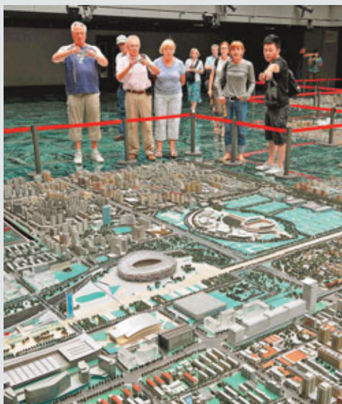
■城市總體規劃不僅包含城市建設，還包括周邊區域一體化思路。圖為外國遊客在北京城市規劃展示廳參觀。 資料圖片

北京未來發展規劃要放到京津冀區域一體化的思路中去，現在有很多問題都不是北京單方面能解決的。雖然北京與周邊河北、天津有一些合作，比如建輕軌等，但都是點上的，還沒有一個整體面上的系統規劃，因此，未來的規劃要進一步凸顯出來。