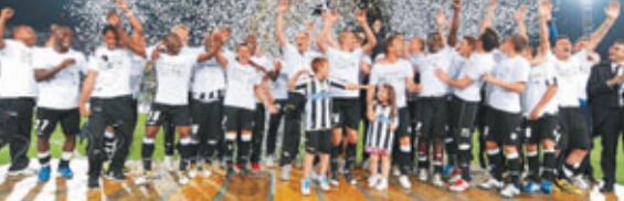
烏甸尼斯在戰和AC後慶祝晉級下屆歐聯。

該隊最終與拉素均積66分。由於兩隊本賽季兩次交鋒一勝一負，所以要比較淨勝球決定最終名次。烏甸尼斯