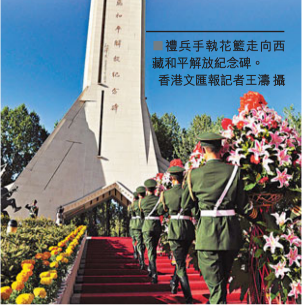
禮兵手執花籃走向西藏和平解放紀念碑。

為犧牲烈士們默哀3分鐘 這5個分別由中共西藏自治區委員會、西藏自治區人大常委會、西藏自治區人民政府、西藏自治區政協及西藏軍區敬獻的大型花籃在紀念碑前一字排開，花籃紅色緞帶上書「革命先烈永垂不朽」8個金色大字。張慶黎神情莊重地走上前去，仔細整理花籃上的紅色緞帶。而後，全場肅立，脫帽，向為西藏和平解放和社會主義革命與建設事業英勇犧牲的烈士們默哀3分鐘。