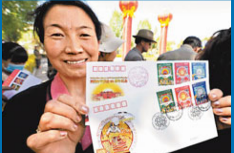
一套三枚的西藏和平解放60周年紀念郵票。

紀念郵票同日發行 另外，中國郵政亦於昨日發行一套三枚的西藏和平解放60周年紀念郵票。此套郵票畫面借鑒唐卡藝術的中心構圖法，將西藏傳統藝術特色和現代構手法融為一體。