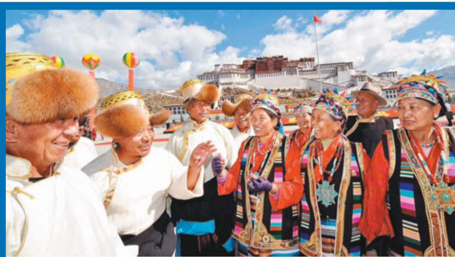
參加西藏和平解放60周年活動的藏族民眾。