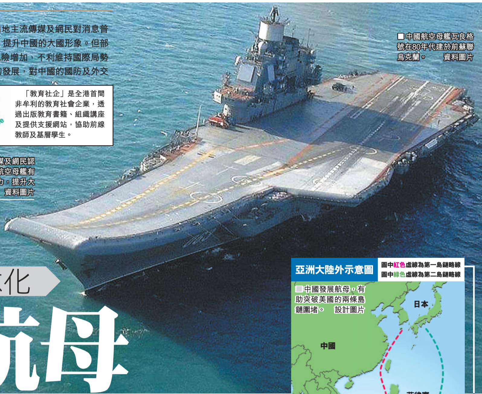
中國航空母艦瓦良格號在80年代建於前蘇聯烏克蘭。 資料圖片