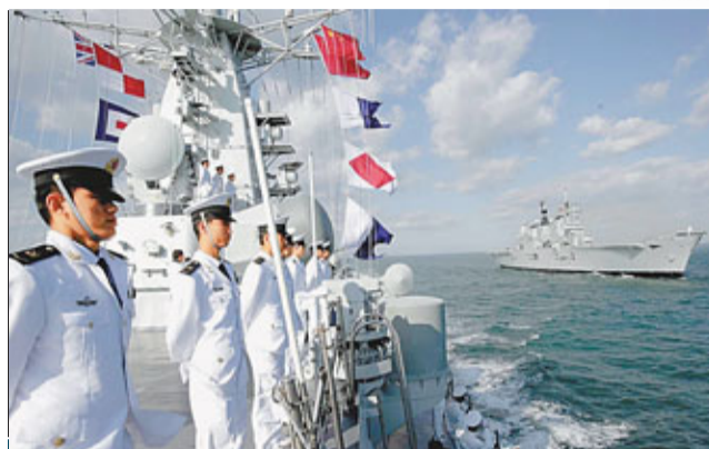
內地主流傳媒及網民認為，中國發展航空母艦有助提高綜合實力，提升大國形象。 資料圖片

「教育社企」是全港首間非牟利的教育社會企業，透過出版教育書籍、組織講座及提供支援網站，協助前線教師及基層學生。