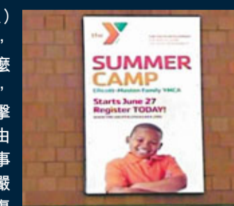
女童去年參加YMCA的日間夏令營，兩度遭17歲導師強姦。

水牛城YMCA主席兼總裁默里聲稱，該會只知道導師與一名營友發生不當行為，今年4月前未收過任何涉及強姦或懷孕的報告。他稱已即時解僱導師，向女童父母報告事件，又對女童的遭遇「深表同情」，正與警方密切合作。