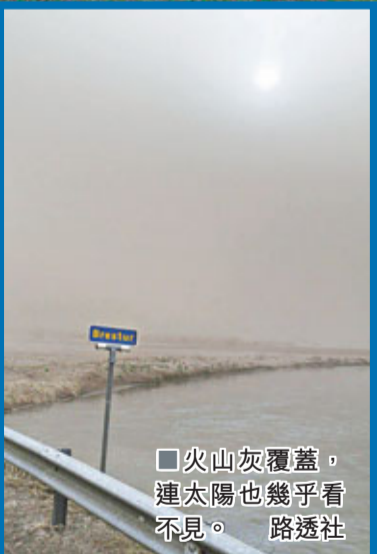
火山灰噴發，連太陽也幾乎看不見。