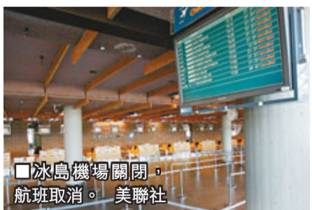
冰島機場關閉，航班取消。

格里姆火山位於瓦特納冰川之下，在冰島首都雷克雅未克東南約145公里，是冰島最活躍火山，自1922至2004年間噴發過9次。在上一次2004年11月的爆發中，火山灰遠飄至歐洲大陸，往來冰島航班大受影響，但沒有機場需要關閉。