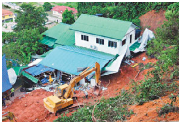
■大量山泥湧入孤兒院。

馬來西亞雪蘭莪州昨日連場暴雨引發山泥傾瀉，淹沒一家住了49人的孤兒院，截至昨晚只有6人獲救，3人證實罹難，約30名小童下落不明，恐怕已遭活埋。