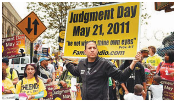
■坎平的追隨者在街上散播末日言論。