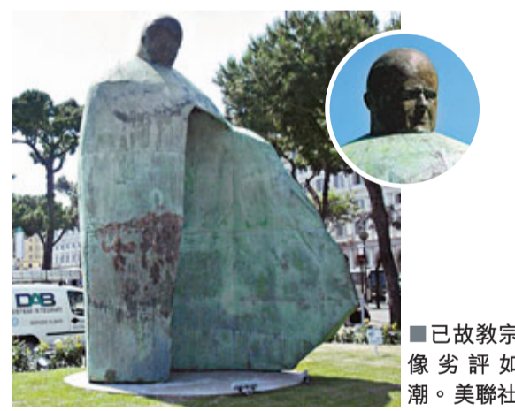
■已故教宗像劣評如潮。