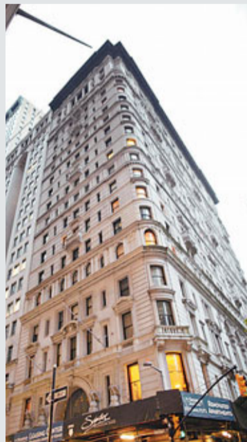
■卡恩在百老匯大道南端租臨時住宅。

國際貨幣基金組織(IMF)前總裁斯特勞斯-卡恩捲入企圖強姦案以來，陰謀論四起，有法國政客披露，卡恩指稱俄羅斯總理普京是把他拖下馬的「惡勢力分子」之一。至於卡恩獲准保釋後，原定入住紐約曼哈頓的豪宅接受24小時軟禁，但房東不滿招徠大批記者，拒絕卡恩入住。他唯有另覓地方棲身，儼如「過街老鼠」。