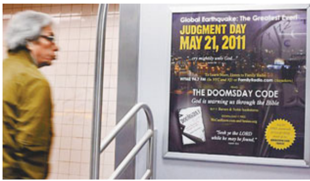
■「家庭電台」在紐約地鐵站賣廣告。