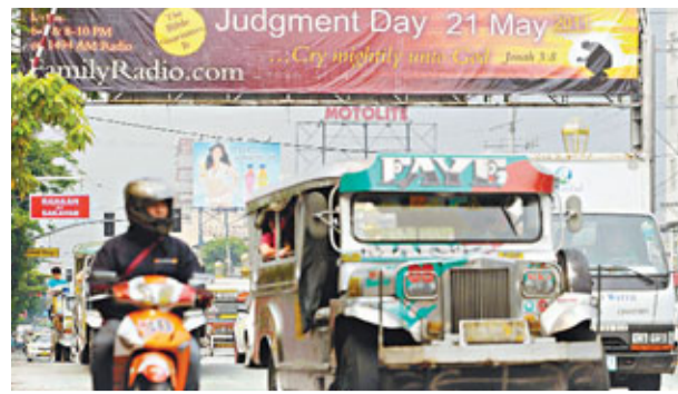
■馬尼拉馬路上架起顯眼的末日廣告。