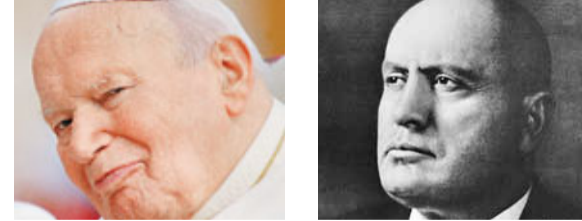
■教宗若望保祿二世 ■墨索里尼