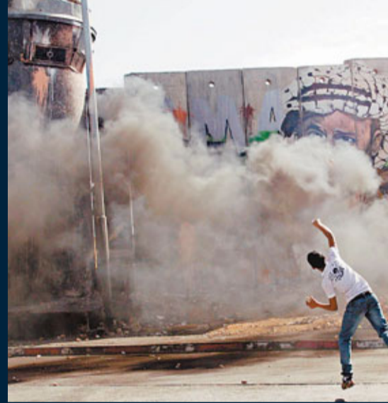
巴勒斯坦青年繼續在西岸附近向以色列擲石。

再者，隨着中東反政府浪潮持續，美國在中東的號召力大減。以埃及為例，在阿拉伯世界，埃及率先承認以色列，算是以以色列罕有的阿拉伯盟友，前總統穆巴拉克更是以巴和談的重要推手；現在埃及變天，親美的穆巴拉克下台，過渡政府取態即變，對哈馬斯立場軟化，更有跡象向堅決否認以色列存在的伊朗靠攏，讓以色列矚目驚心。形勢如此，奧巴馬如何使雙方釋疑？情況令人不樂觀。 ■張啟宏