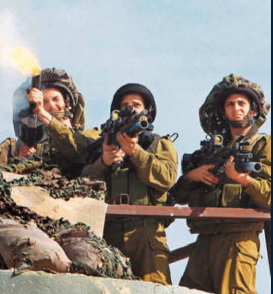
以軍與巴人衝突，發射催淚彈企圖制止巴人。 路透社

巴勒斯坦不滿內塔尼亞胡的強硬態度，阿巴斯發言人表示，內塔尼亞胡從官方層面否定了奧巴馬的提議和國際法。阿巴斯指奧巴馬應向對方施壓，迫使接受方案。哈馬斯發言人則指，內塔尼亞胡的態度，顯示跟以色列和談「荒謬」，呼籲繼續「對抗」，維護巴人利益。 ■路透社/美聯社/法新社/《紐約時報》