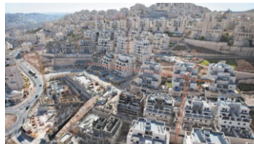
以色列在東耶路撒冷的霍馬山一帶修建住宅，該處地區是以巴邊界備受爭議的區域。美聯社

出怎樣解決。 奧巴馬又批評巴勒斯坦單方面推動在聯合國承認其獨立的行動，指尋求孤立以色列不會為巴勒斯坦帶來一個獨立國家。奧巴馬又指，未來巴勒斯坦國必須實現非軍事化，並指巴勒斯坦塔塔赫和激進組織哈馬斯和解，為以色列帶來「合理疑問」。 奧巴馬的演說一出，即時觸怒以色列總理內塔尼亞胡，他指奧巴馬的方案會使猶太人聚居點暴露於以色列邊界之外，揚言以色列不會撤出西岸。內塔尼亞胡又要求華府遵守前總統布希在2004年所作的保證，布希當時表示，要以巴邊界回到1967年的情況是「不切實際」。 巴人自治政府主席阿巴斯則歡迎奧巴馬為重啟和談所作的努力，他已召開緊急會議，商討奧巴馬提出的方案。哈馬斯發言人則表示，哈馬斯和法塔赫和解是巴勒斯坦內部事務，巴勒斯坦人不須聽奧巴馬講道理。 ■路透社/美聯社/法新社/《紐約時報》/《華爾街日報》