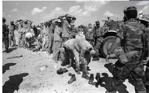
1967年六日戰爭期間，大批埃及軍人在西奈半島向以軍投降。

話你知 以色列與阿拉伯國家於1967年爆發的六日戰爭，重繪中東地圖，也重設以色列與鄰國的均勢，在過去數十年對以色列人、巴勒斯坦人以至整個中東地區，均有極其深遠的影響。 以色列1948年立國以來，阿拉伯人認為家園被佔，故一直抵制對方。1967年6月5日，以色列先發制人，發動稱為「六日戰爭」的第三次中東戰爭，只花6日便徹底打敗埃及、約旦和敘利亞的軍隊。 戰事約有700名以色列人及逾2萬阿拉伯人喪生，另有數十萬阿拉伯及巴勒斯坦人淪為難民。以色列佔領約旦的東耶路撒冷及約旦河西岸、埃及的加沙地帶和西奈半島，以及敘利亞的戈蘭高地，這些土地的面積比以色列原來國