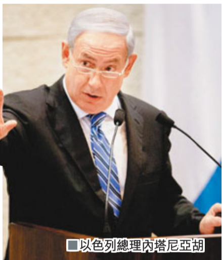
以色列總理內塔尼亞胡

1967年六日戰爭爆發，以色列從阿拉伯國家手上奪得約旦河西岸、加沙地帶和東耶路撒冷等土地。聯合國安理會同年11月和1973年10月兩次通過決議，要求以色列歸還1967年佔領的巴勒斯坦領土但不果。 在華府斡旋下，以巴雙方去年9月初在華盛頓重啟直接和談，但和談僅兩星期，就因以色列拒絕在猶太人定居點建設問題讓步而擱淺。以色列繼續在約旦河西岸修建定居點，巴勒斯坦人則退出和談，導致和平進程停頓。