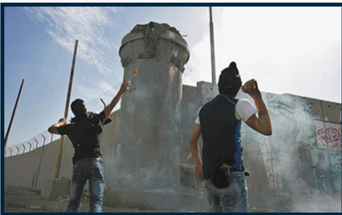
巴勒斯坦示威者在耶路撒冷的以巴分界處，擲石塊襲擊以色列哨崗。