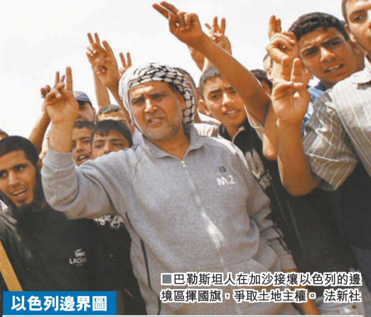
巴勒斯坦人在加沙接壤以色列的邊境區揮舞國旗，爭取土地主權。