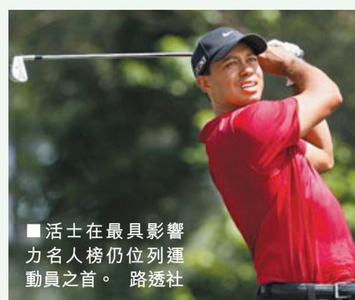
活士在最具影響力名人榜仍位列運動員之首。

活士曾在世界第一的位置上停留623周，自從1986年世界排名啟用以來，他是在第一位置上停留時間最長的球手，然而2年前的桃色醜聞曝光後，活士的世界排名就一直呈現下滑態勢。