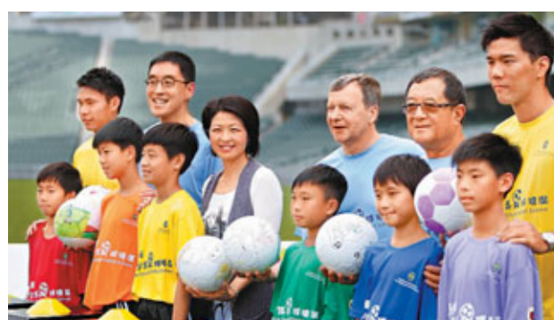
「賽馬會青少年足球推廣2011」現已接受報名。

香港文匯報訊(記者 郭正謙)旨在為香港球壇培養明日之星的「賽馬會青少年足球推廣2011」，昨日正式開始接受全港5至19歲青少年報名，此外足總主席梁孔德表示為