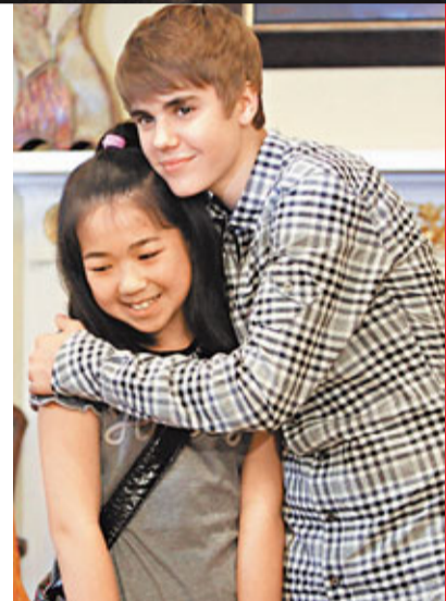
日前在日本探訪小朋友的小Justin位列名人榜第3位，是榜上最年輕的名人。