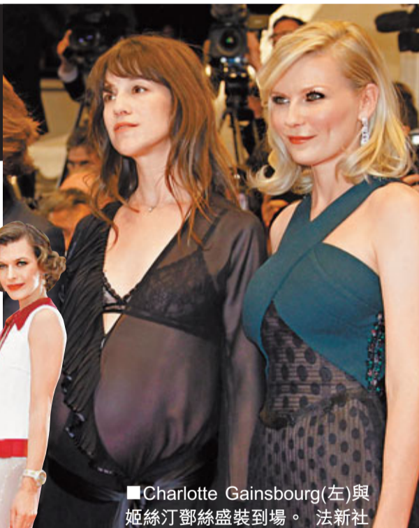
Charlotte Gainsbourg(左)與姬絲汀鄧絲盛裝到場。