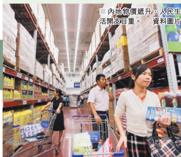
內地物價遞升，人民生活開支日重。資料圖片

是次改革主要是兩方面：一是將起徵點由每月2,000元提高至每月3,000元；二是工資薪金所得的9級超額累進稅率級數減至7級，取消15%和40%兩個稅階，擴大5%和10%兩個稅階的適用範圍，並擴大最高稅率45%的覆蓋範圍。