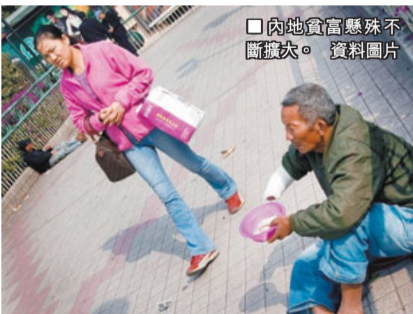
內地貧富懸殊不斷擴大。

1994年，國家實行分稅制，個人所得稅被劃為地方政府的稅收。2002年，個人所得稅改為中央政府與地方政府的共用稅，兩者各分一半。至2003年改為中央分享60%、地方分享40%。由此可見，該稅無論對中央政府或地方政府來說，都是非常重要的稅收：對中央政府而言，超過6%稅收來自個人所得稅，中央政府依賴此稅作為轉移支付，支持中西部地區的發展；對地方政府而言，如北京近年的個人所得稅收入僅次於營業稅，高峰時佔整體稅收25%。因此，若該稅有