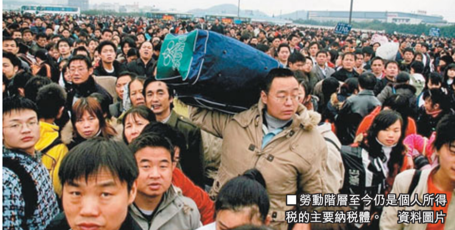
勞動階層至今仍是個人所得稅的主要納稅體。資料圖片

今年2月，國務院總理溫家寶在與網民交流時透露，國家將討論提高個人所得稅薪酬的起徵點至每月3,000元(人民幣，下同)。結果，全國人大常委會辦公廳在4月公布《中華人民共和國個人所得稅法修正案(草案)》，並向社會徵求意見。當局於半個月內在網上已收到超過廿萬條意見，打破紀錄，可見內地社會對個人所得稅法改革極關注。究竟當局為何調整個人所得稅？調整時有哪些方面需考慮？當局往後應從甚麼方向改革？本文將逐一探討。