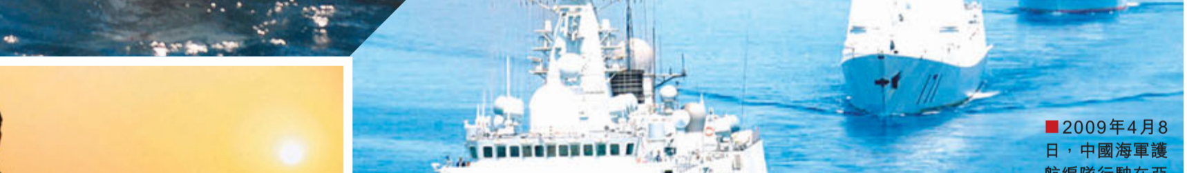
2009年4月8日，中國海軍護航編隊執行在亞丁灣海域。