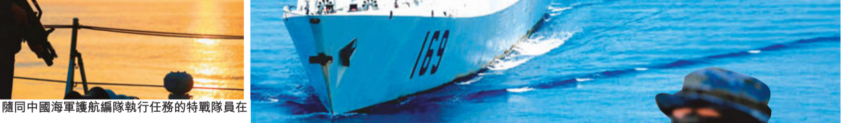
2009年4月8日，中國海軍護航編隊執行在亞丁灣海域。

特戰隊員警守船舶安全。 2009年11月23日，國際海事組織第26屆大會在倫敦開幕。開幕式上，該組織秘書長授予在亞丁灣、索馬里海域執行護航任務的中國海軍護航編隊「航運和人類特別服務獎」。獲此殊榮，源於中國海軍護航官兵認真履行國際人道主義義務，積極為申請護航的外國商船提供安全保護，在險象環生的亞丁灣、索馬里海域為中外船舶鋪就了一條平安大道。