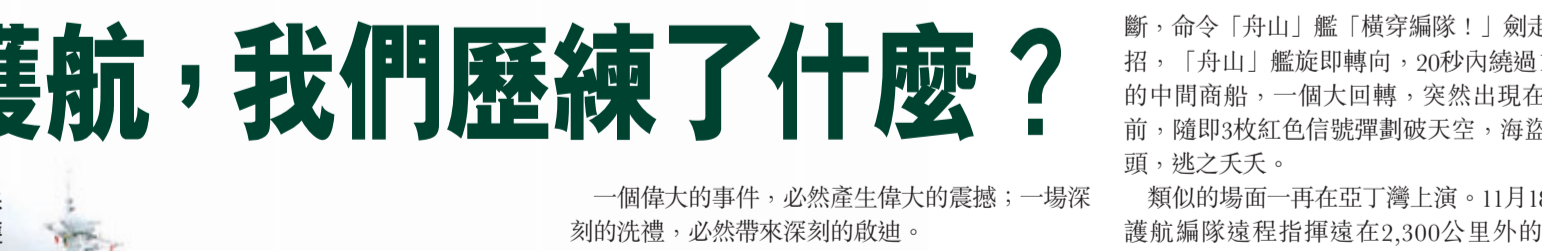
2009年2月20日，隨同中國海軍護航編隊執行任務的特戰隊員在執行警戒。