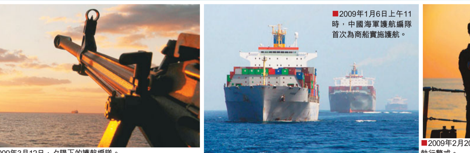
2009年1月6日上午11時，中國海軍護航編隊首次為商船實施護航。