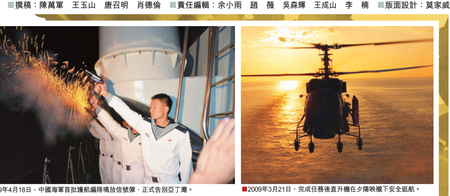
2009年4月8日，中國海軍護航編隊執行在亞丁灣海域。

2009年9月10日，中國護航編隊首次與俄羅斯海軍實施聯合護航。2009年11月22日，中國護航編隊與荷蘭海軍護航艦艇互派兩名官兵駐艦考察交流。2010年5月13日，中韓兩國護航艦艇舉行首次聯合演練。雙方指揮員交換指揮……交流是多層面的。護航以來，中國護航編隊指揮員與俄羅斯海軍護航編隊、北約海軍508編隊、歐盟海軍465編隊、美國151特混艦隊、日本海上自衛隊等護航編隊指揮官進行了會面交流和互訪；中國護航編隊每天都能收到外國海軍艦艇發來的情況通報，中國編隊也將自