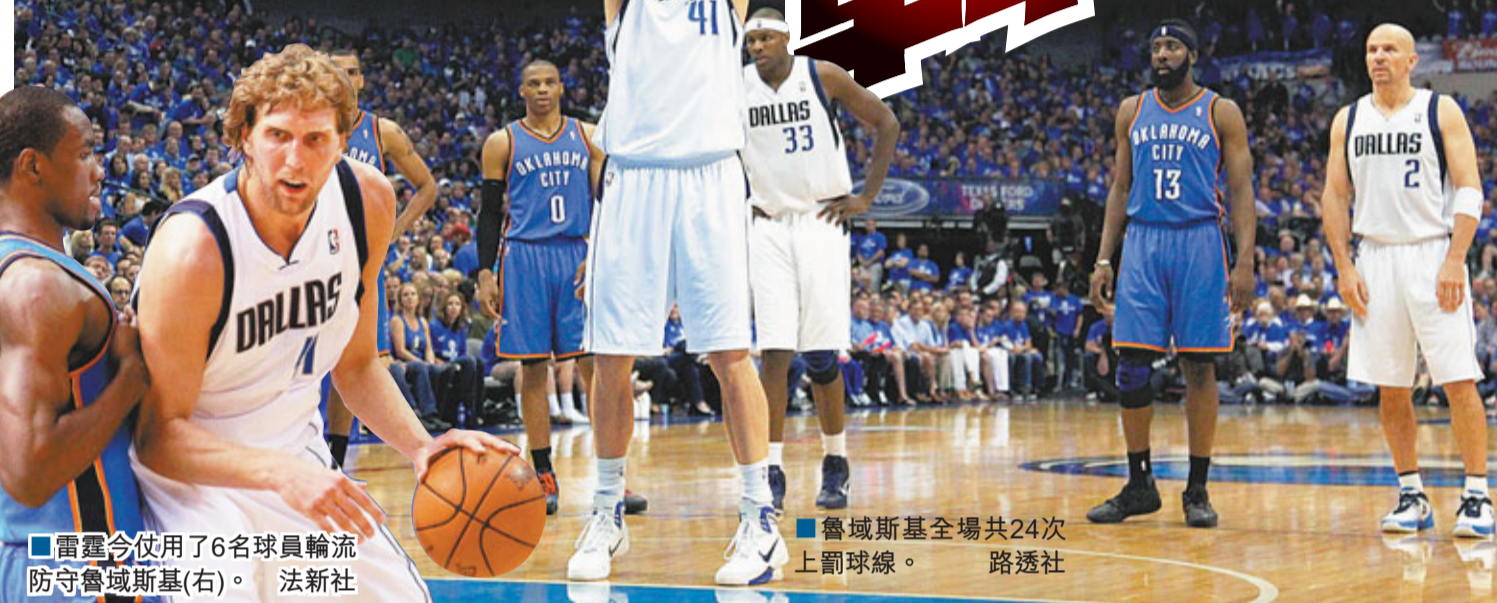
雷霆今使用了6名球員輪流防守魯域斯基(右)。

據新華社17日電 雷霆想盡和動用所有手段，但仍難阻止魯域斯基的猛烈進攻。在17日揭幕的西岸決賽首場賽事中，小牛靠「德國槍」魯域斯基轟進全場最高的48分，主場以121:112擊敗雷霆。魯域斯基是役15次起手投入12球，罰球24投全中，書寫NBA季後賽投進最多罰球的歷史最高紀錄。