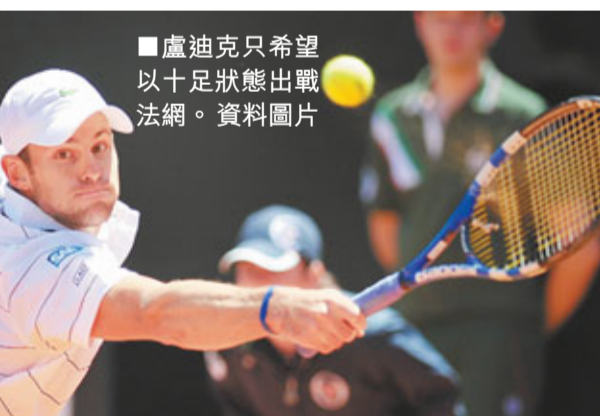
盧迪克只希望以十足狀態出戰法網。