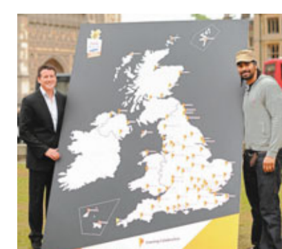
高爾(左)與英國重量級拳王海耶展示倫敦奧運火炬傳遞路線。

據新華社18日電 倫敦奧運會組委會18日公布在英國本土的74個火炬傳遞地點，8000名火炬手將在2012年5月18日後手持火炬在這些地點進行傳遞。倫敦奧運會火炬傳遞路線將覆蓋英國主要城市，包括曼徹斯特、伯明翰、加迪夫和愛丁堡等，奧運會開幕一周前，聖火將抵達倫敦市進行傳遞。倫敦奧運會主席高爾表示：「奧運聖火將在英國的所有地區傳遞。」倫敦奧運會開幕式將於2012年7月27日舉行。