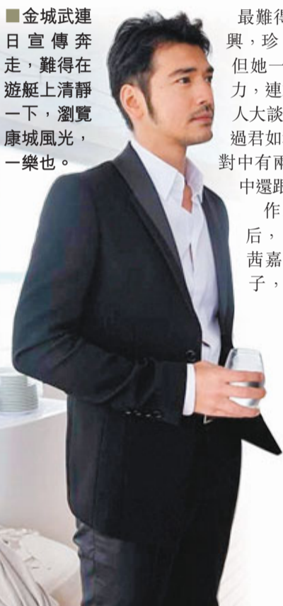
金城武連日宣傳奔走，難得在遊艇上清靜一下，瀏覽康城風光，一樂也。

發行商Harvey被譽為「奧斯卡推手」，其出品及發行的電影，累積奪下61尊奧斯卡小金人，包括《標殺令》、《皇上無話兒》等。在簽署合約時，他毫不掩飾道：「我買《武俠》，就是為了奧斯卡！」《武俠》將於年尾準備在北美全面發行，是繼《臥虎藏龍》後又一在美國大規模公映的華語電影。