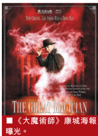
《大魔術師》康城海報曝光。