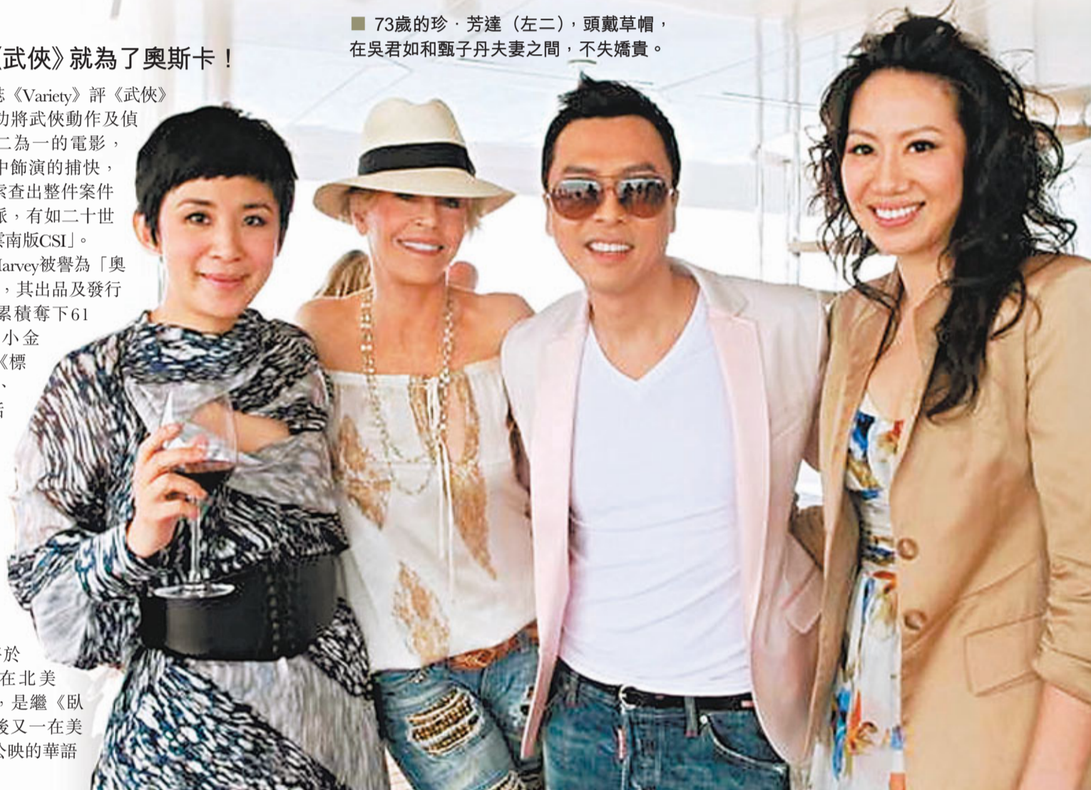
73歲的珍·芳達 (左二)，頭戴草帽，在吳君如和甄子丹夫妻之間，不失嬌貴。