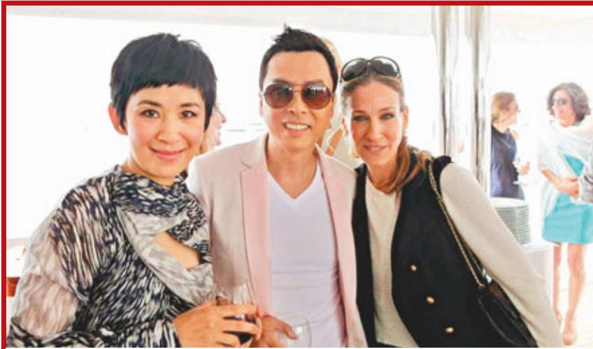
「色慾女」莎拉謝茜嘉柏嘉「三顧」《武俠》活動，跟甄子丹、吳君如已成了老友。