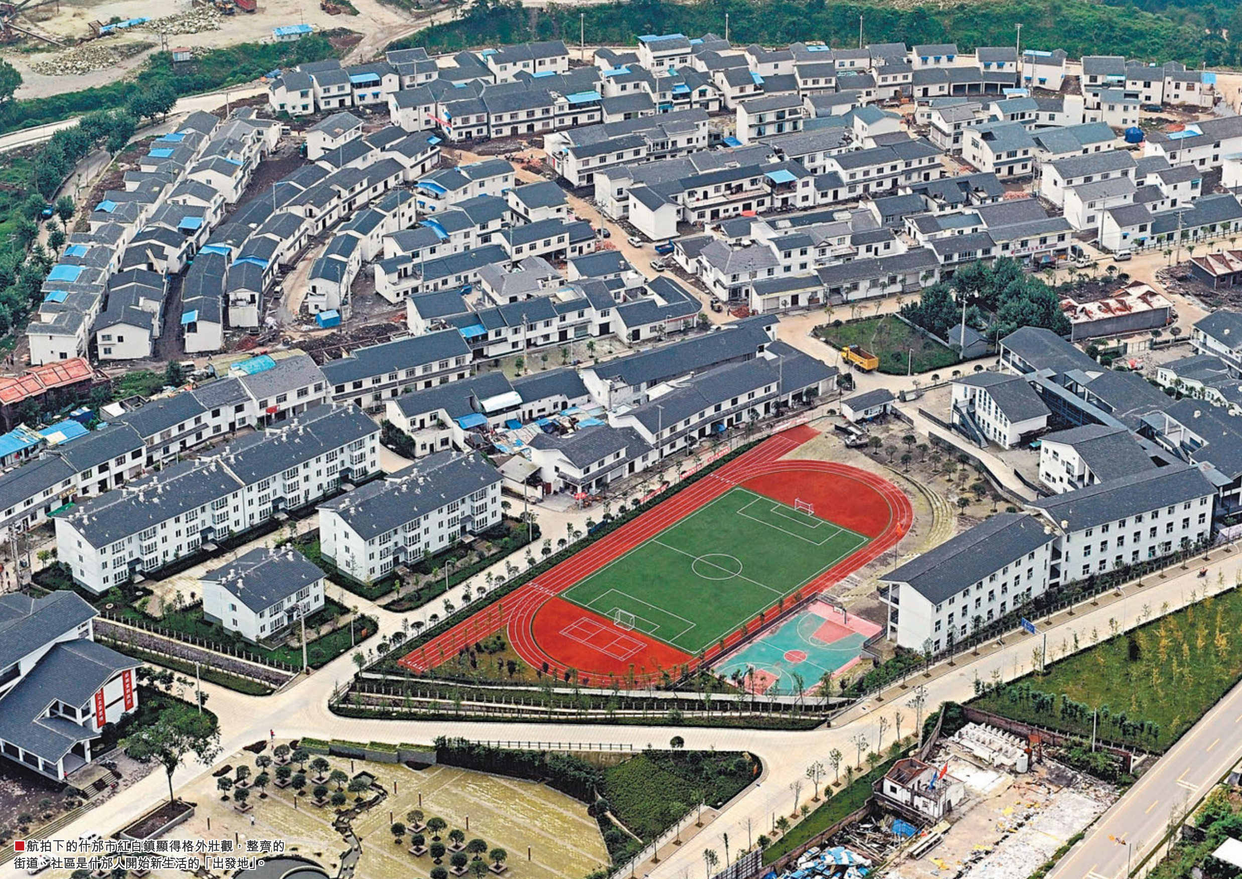
航拍下的什邡市紅白鎮顯得格外壯觀，整齊的街道、社區是什邡人開始新生活的「出發地」。