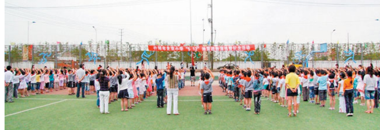
紀念「汶川大地震」三周年，什邡市北京小學在學校操場上舉行隆重的升旗儀式。