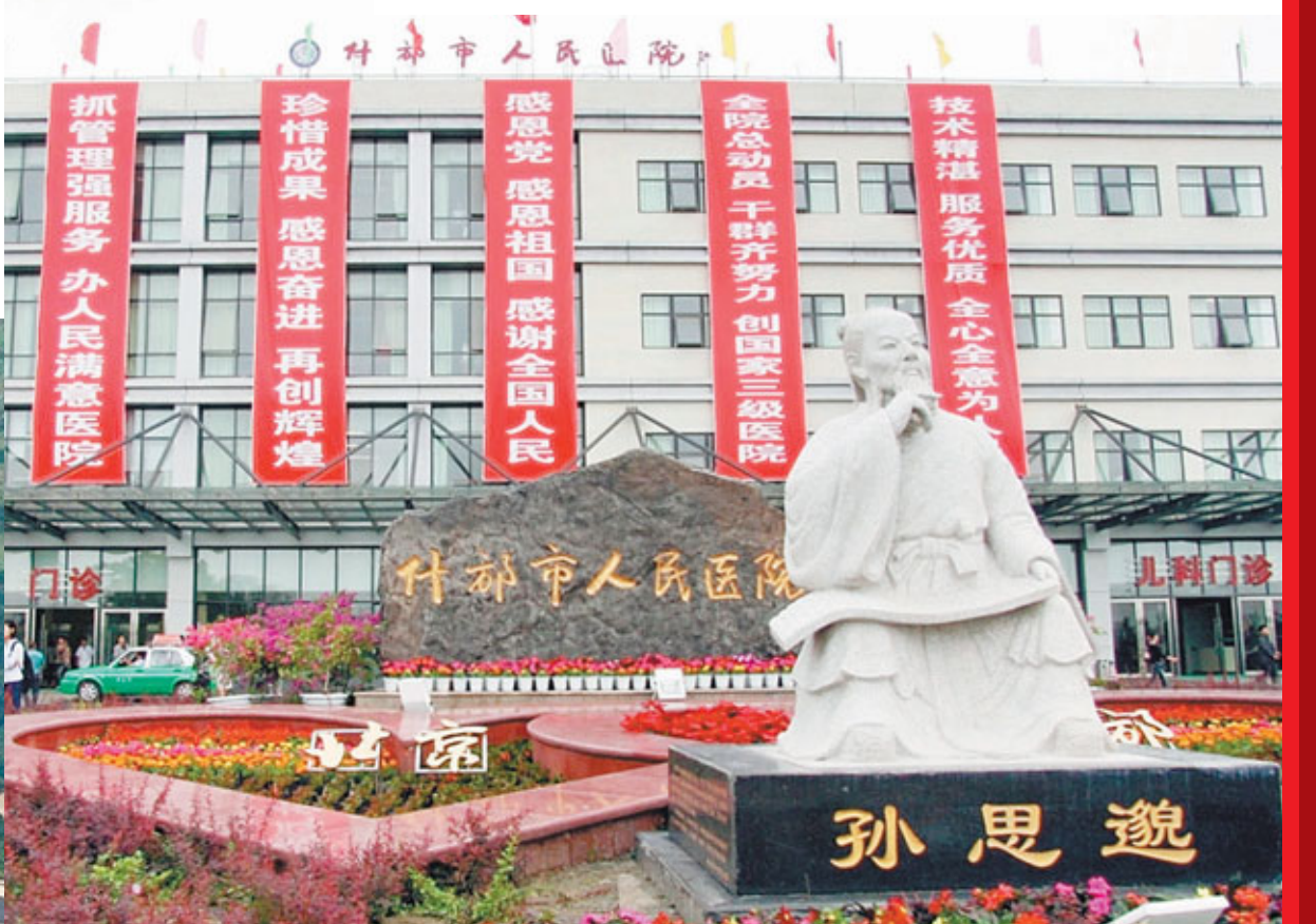
新建的什邡市人民醫院——北京市對口援建項目重點工程之一。北京市用不到兩年時間建成一所綜合醫院，充分體現了北京效率。

香港文匯報訊（記者 李茜婷 北京報道）一條條平坦、寬闊的馬路；一座座灰瓦白牆的住宅樓；一間間寬敞、明亮的教室；一張張真誠、感恩的笑臉……曾經滿目瘡痍的重災區——四川省什邡市如今面貌一新，煥發著勃勃生機。汶川特大地震發生三年來，在北京市的對口援建下什邡實現了歷史性巨變，北京市不僅在基礎設施、醫療教育、城市規劃等各方面對什邡進行了輸血，更在產業園建立、引進企業資源等方面對什邡進行了「造血」。如今，70億元（人民幣，下同）的援建資金已變成一座座高樓大廈和一份份沉甸甸的感情，惠澤到每一個什邡的尋常百姓家並溶入什邡人的心裡。