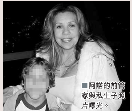
▲阿諾的前管家與私生子照片曝光。 美國加州前州長阿諾諾華辛力加坦承10多年前和家中女管家有染並誕下私生子後,他的妻子施賴弗前日發表聲明,形容這是「痛苦而令人心碎的時刻」;他的17歲兒子則在網上留言表達哀傷及渴望正常生活。有網站披露阿諾私生子的母親是前任管家巴埃納,並上載巴埃納與阿諾的合照。