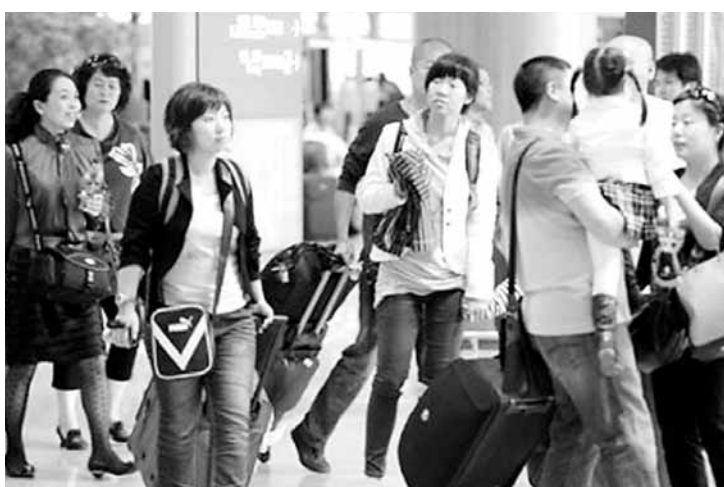
▲外遊的中國人成為推動全球經濟增長的重要因素。 以美國為例,過去10年長途客增長疲弱,完全跟不上全球約40%的增幅。美國簽證制度趕客,自「911」恐襲後,美國要求每位申請人面見領事級官員,中國和巴西申請人的輪候面試時間分別長達120和100天,面試地點分別只有5個和4個。USTA上周發表報告呼籲改革,包括增聘400名領事面試員,容許視像會議面試,以及研究對巴西等國家免簽證。 ■法新社

美國旅遊協會(USTA)的羅傑·道指出,需求上漲和基建落後是雞和蛋的問題,他認為美國需認真檢討基建設施,包括下一代的機場系統,提高機場處理客運量的能力。準備不足的國家將面臨轉頭,斯科西爾說,「發達國家領袖不完全明白旅遊業的影響,一切視作理所當然,不像發展中國家的態度。」