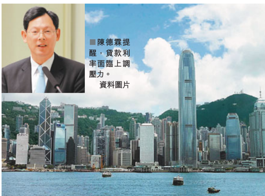
香港銀行貸款增長分析

香港文匯報訊(記者 馬子豪)受經濟復甦、樓市暢旺及內企南下「借平錢」等信貸需求帶動，港銀放貸急增，貸存比率由去年初的71%急升至今年三月底的82%，在資金偏緊下，港銀近期已率先上調「有肉食」的樓按息率，加息潮並有向企業及私人貸款蔓延之勢。金管局總裁陳德霖昨再度提醒，因應本港貸款增長超越存款增長的趨勢，以及旺盛的貸款需求，加上市場利率趨升，貸款利率面臨上調壓力，叮囑市民小心借貸以免還款能力受到影響。